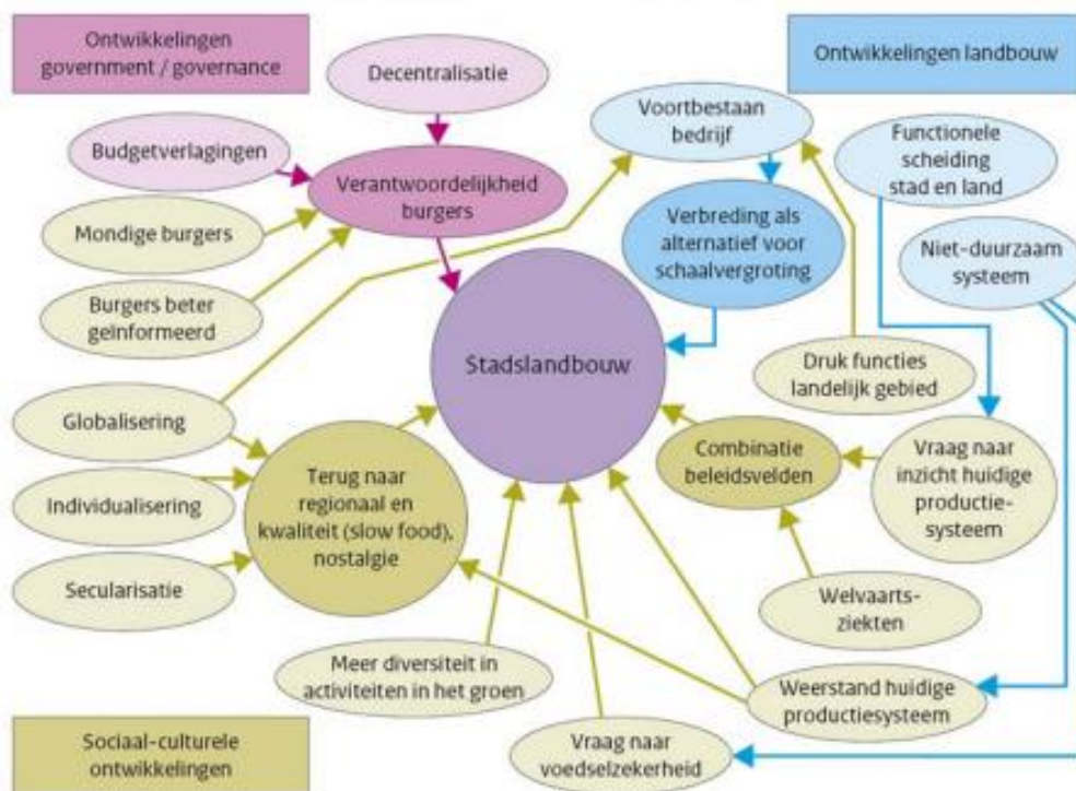
Figuur 2: Maatschappelijke ontwikkelingen die van invloed zijn op de trend stadslandbouw

In Figuur 2 worden bovenstaande maatschappelijke ontwikkelingen weergegeven met nog een aantal andere factoren.