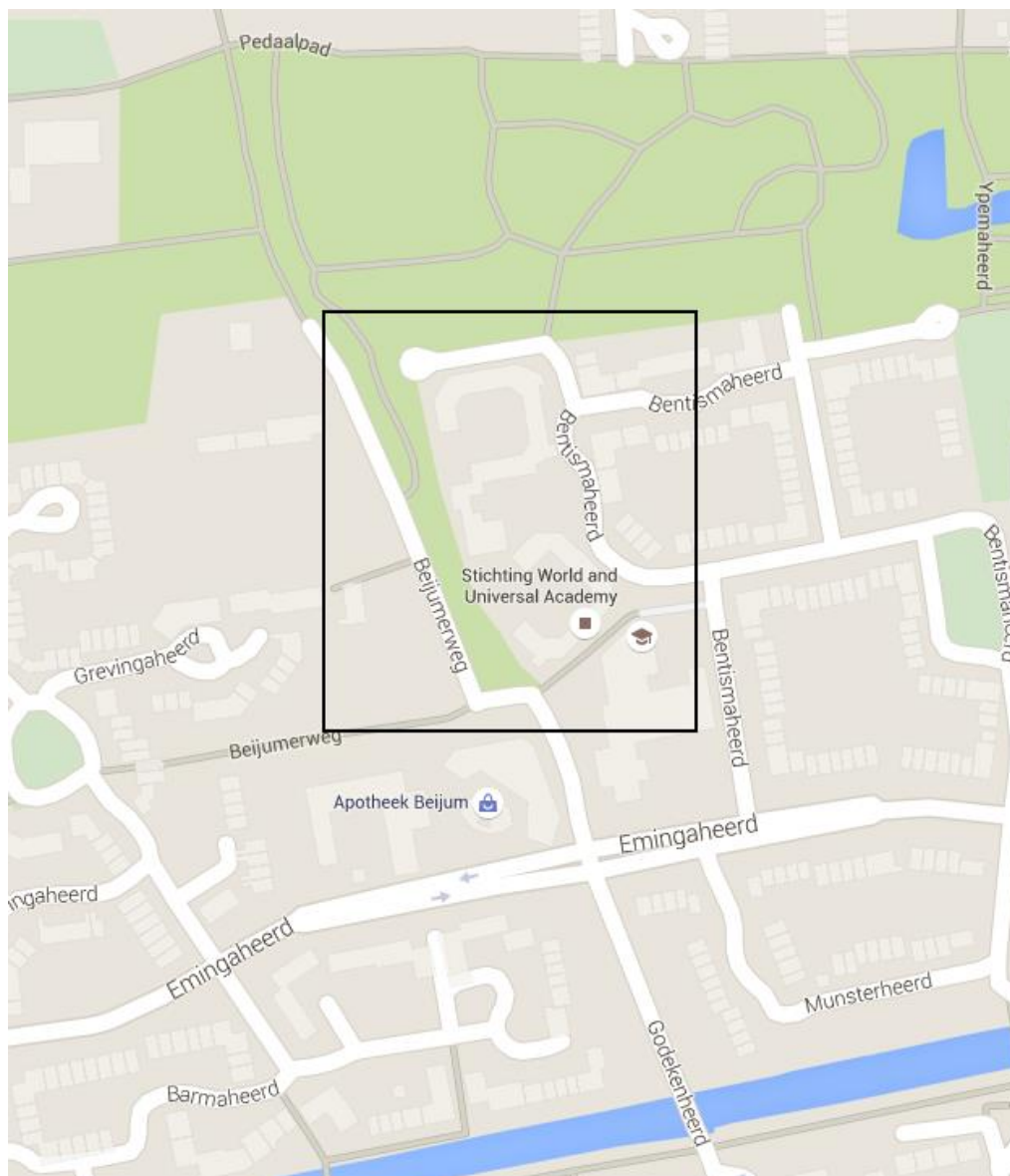
Afbeelding 2. Locatie de Heerd in Beijum, Groningen