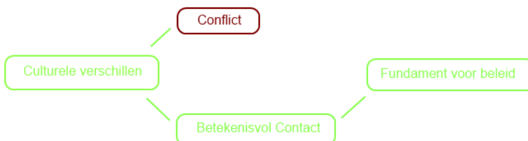
Afbeelding 1. Conceptueel model

Het wooncomplex is gelegen in de wijk Beijum te Groningen, op onderstaande afbeelding is te zien hoe het gelegen is midden in de wijk.