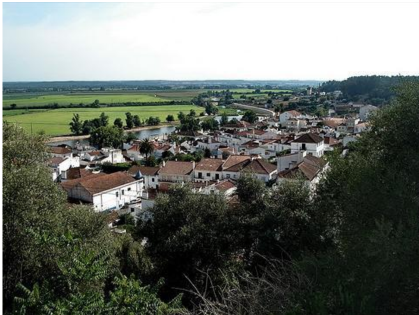
Figuur 6.7: Indruk van Coruche

De regio laat zien dat het platteland ook heel welvarend kan zijn. De primaire sector lijkt hier nooit echt een belangrijke rol te hebben gespeeld en dat verklaard wellicht ook de uitkomsten van de interviews. Een gemeenschap waarin de landbouw centraal staat is dit in de nabije geschiedenis niet geweest, want de inkomens zijn afkomstig uit andere sectoren.