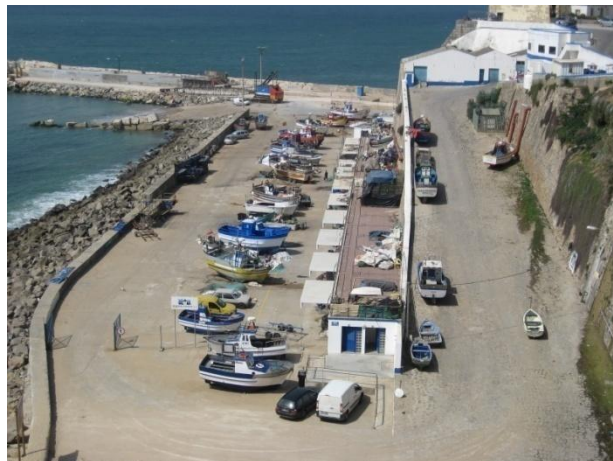
Figuur 6.4: De haven van Ericeira