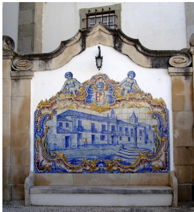
Figuur 6.6: Azulejos in Coruche