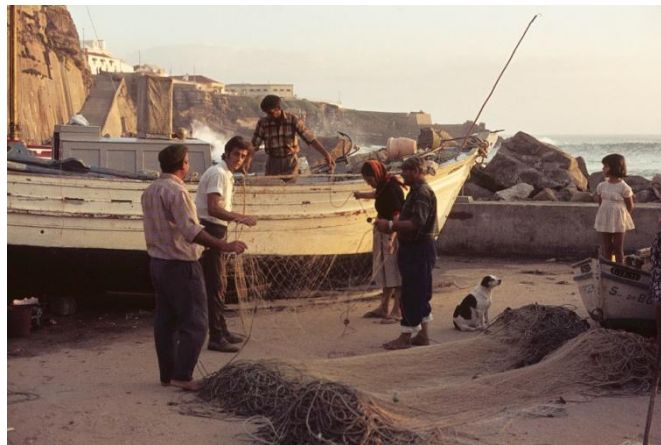
Figuur 6.5: Vissers in Ericeira: spoedig verleden tijd?

Op verschillende manieren is hulp gevraagd, maar het antwoord was volgens dhr. Pereira altijd hetzelfde: "Sorry, maar we moeten met onze tijd mee en de toekomst van deze regio ligt niet in de visserij". Dit is voor alle mannen een niet te begrijpen antwoord. De toekomst van de visserij ligt in hun eigen handen en door het zoeken naar nieuwe mogelijkheden om geld te verdienen doen ze een poging om de visserij in stand te houden.