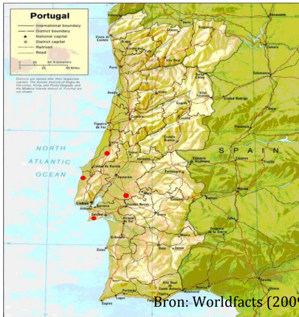
Figuur 5.1: Kaart Portugal