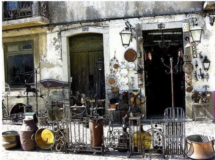
Figuur 6.1: Antiekwinkel in Azeitao