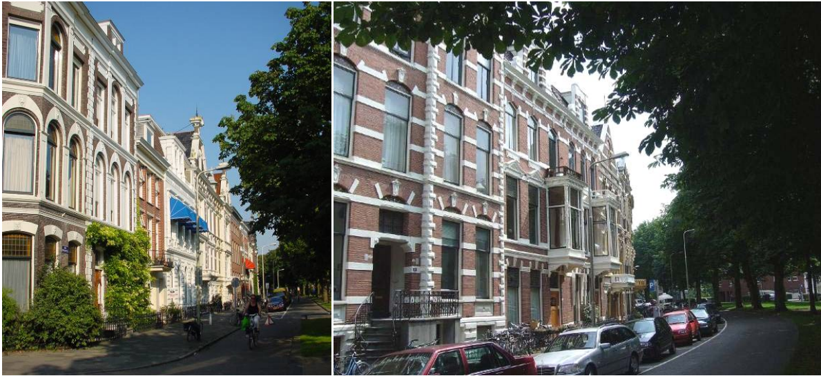
Herenhuizen aan de groene singels (links: Ubbo Emmiusingel, rechts: Praediniussingel)