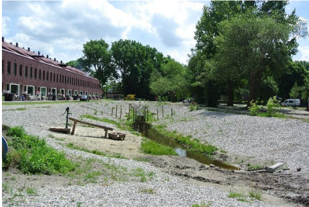
Afbeelding 3: Zonneplantsoen

In de wijk bevinden zich twee openbare parken, namelijk het Zonneplantsoen en het Bessemoerpark. Het Bessemoerpark is een nieuw ontwikkeld park ten oosten van de wijk. Het Zonneplantsoen bevindt zich te midden van de wijk langs de Zonnelaan.