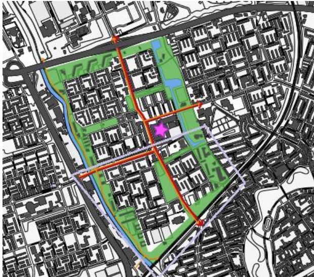
Afbeelding 2: Situering Paddepoel zuid –en noord

Het aantal inwoners van Paddepoel-Zuid bedroeg 4.268 inwoners in 2012 (Onderzoek en Statistiek Groningen, 2014). Het aandeel kinderen in de leeftijd 0 tot 14 jaar 21.6% en het aandeel jongeren in de leeftijd 15 tot 25 jaar 15.6% (CBS, 2014). De gemiddelde grootte van de huishoudens is 1.7 (CBS, 2012).