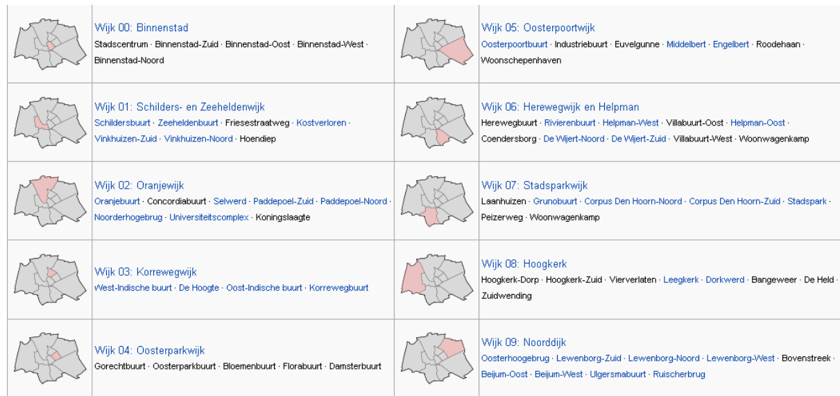
Afbeelding 1: Statistische wijken in Groningen (CBS, 2009)

Het onderzoek is uitgevoerd in de vorm van een casestudie. Deze casestudie heeft plaats gevonden in de wijk Paddepoel-Zuid (gelegen in Oranjewijk) in de stad Groningen. Het eerder genoemde behoud van de historische structuur van de oude stad, geeft een enorme variatie aan voorzieningen op korte afstand van elkaar, een grote diversiteit aan woon- en werkmilieus en een goede mix tussen karakteristieke oude en nieuwe gebouwen. Op afbeelding 1 zijn de tien verschillende wijken te zien die het Centraal Bureau van de Statistiek (CBS) hanteert met de daarbij behorende buurten (CBS, 2009).