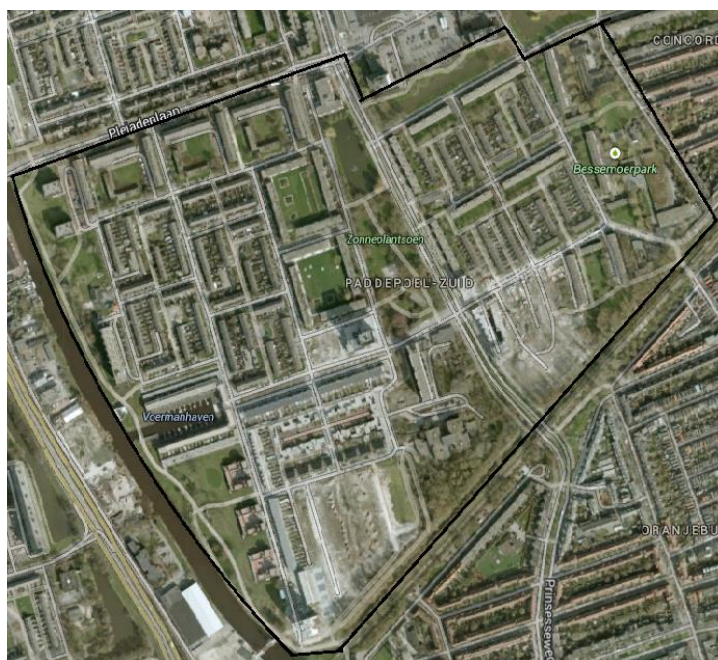
Afbeelding 6: Overzicht hoeveelheid groen in Paddepoel-zuid

Uit de observaties, zie ook afbeelding 6 en bijlage 3, is gebleken dat er relatief veel openbaar groen in de wijk aanwezig is. Uit de literatuur blijkt dat hoe meer groen er in de wijk aanwezig is, hoe meer men sociaal actief is en meer mensen uit de buurt kent (Kuo et al., 1998). Uit dit onderzoek blijkt dat er inderdaad veel activiteiten in de buurt in de groene ruimte plaats vinden. Dit gebeurt met name op kleine grasveldjes tussen burens en vrienden, rondom de woningen. Echter deze activiteiten gebeuren zoals vermeld tussen burens en vrienden, met uitzondering van de moestuin. Dit komt overeen met de literatuur van Kuo et al., (1998). In Paddepoel-zuid kent men voornamelijk elkaars burens en volgens de respondenten kennen ze weinig mensen uit de buurt en hebben ze uitsluitend contact met hun burens. Echter de gebruikers die in het groen komen hebben regelmatig sociale interacties met andere mensen uit de wijk. Hierdoor kennen ze wel degelijk meer mensen uit de buurt dan alleen hun burens.