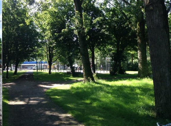
Afbeelding 4: Bessemoerpark

Uit de observaties is gebleken dat de parken Zonneplantsoen en Bessemoerpark niet veel gebruikers hebben. Op afbeelding 3 is te zien dat het in het Zonneplantsoen doorgaans erg rustig is. Op de achtergrond is de voetbalkooi te zien. Deze wordt wel veel gebruikt door jongeren in hun vrije tijd.