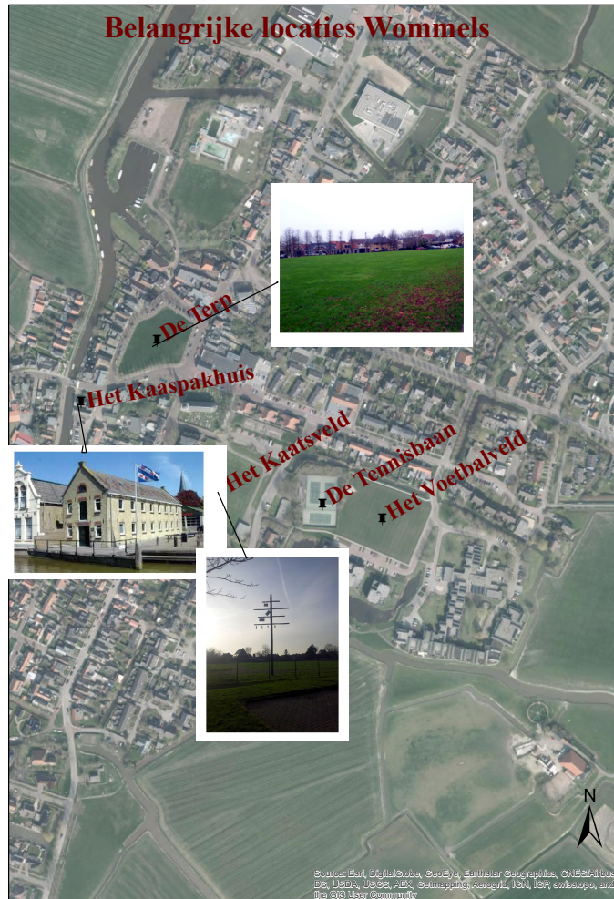
Afbeelding 1: Belangrijke locaties in Wommels

De derde locatie is het kaatsveld en het aan het kaatsveld gerelateerde standbeeld van de Freule. Het standbeeld van de Freule is te zien op afbeelding 2. Het standbeeld van de Freule is van betekenis voor de dorpsidentiteiten, omdat de vrouw een belangrijke rol heeft gespeeld in de ontwikkeling van kaatswedstrijden in Wommels. Zij financierde de eerste kaatswedstrijden en bijbehorende prijzen. Daarnaast stelde ze sociale regels op zoals gratis toegang tot de wedstrijd voor leden van de kaatsclub Wommels en mindervermogene inwoners. Door de initiatief van de Freule, het kaatsen en de wedstrijd in het dorp is de Freulepartij echt verbonden met Wommels (Blom, 2007).