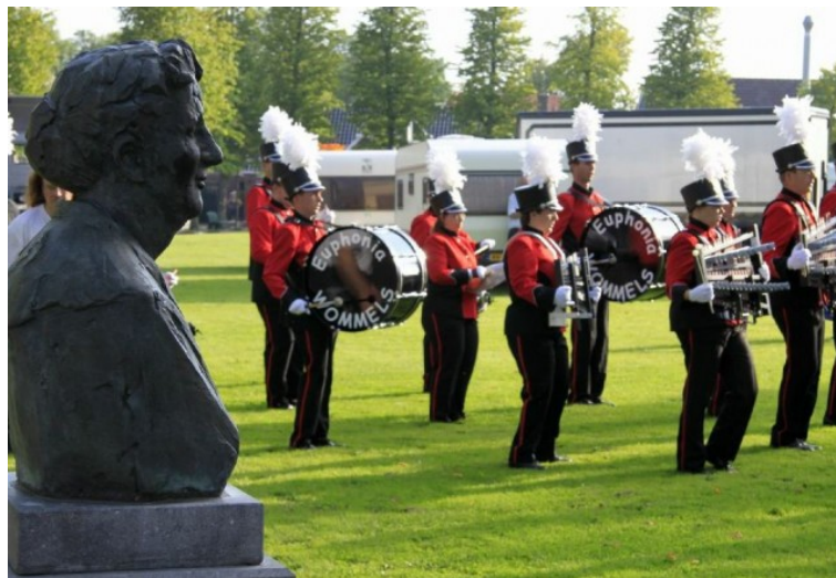
Afbeelding 2: Standbeeld van Clara Jacoba Freule de Vos van Steenwijk

Het citaat illustreert dat het kaatsen voor de inwoners die de sport niet actief beoefenen in de dorpsidentiteit niet een actieve rol speelt, maar de wedstrijd van de Freulepartij wel.