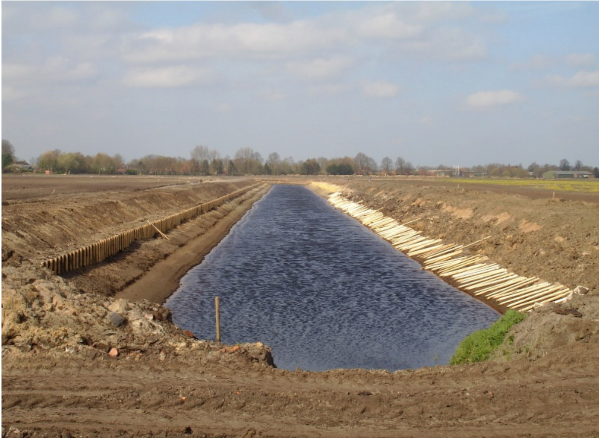
Afbeelding 3.2: Nieuw gegraven vaarverbinding tussen het Kieldiep en het meer Langebosch