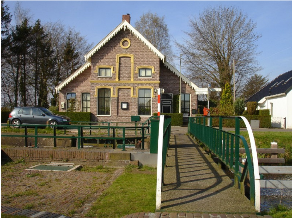
Afbeelding 5.2: De sluiswachterswoning

Anders is dit bij de sluis . Bewoners geven aan enigszins te denken aan de sluis bij het denken aan Kiel-Windeweer. Het is meer een onderdeel van de identiteit van Kiel-Windeweer dan de voormalige dam . Opvallend hierbij is dat er een sterk lineair verband bestaat tussen de sluis en de sluiswachterswoning . De Spearman's Rho correlatiecoëfficiënt blijkt significant te zijn. Bewoners die zeggen meer te denken aan de sluis zeggen ook meer te denken aan de sluiswachterswoning.