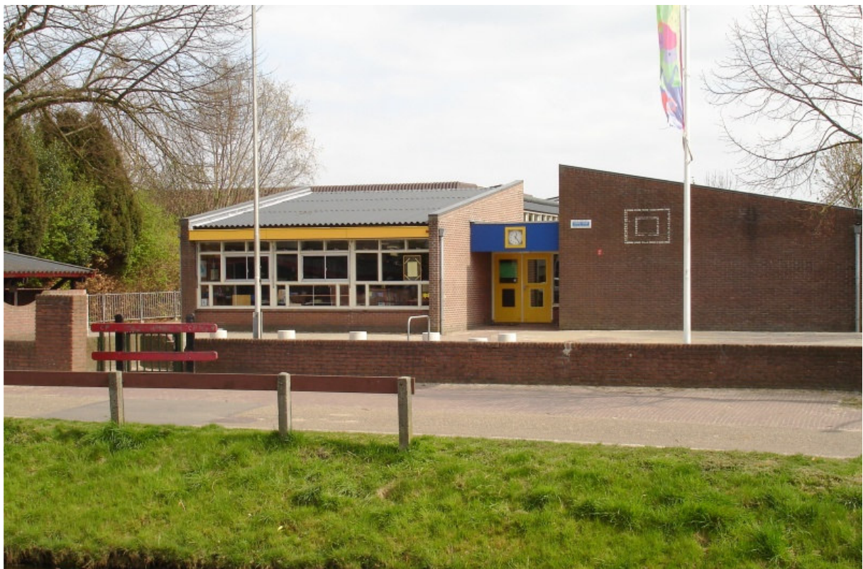
Afbeelding 5.4: De Albrondaschool

Deze resultaten voor de Albrondaschool vertonen veel overeenkomsten met de resultaten van een eerder uitgevoerd onderzoek over leefbaarheid op het Drentse platteland (Witt & Tuinstra, 2006). In dit onderzoek kwam naar voren dat dorpsbewoners veel waarde hechtten aan de laatste voorzieningen.