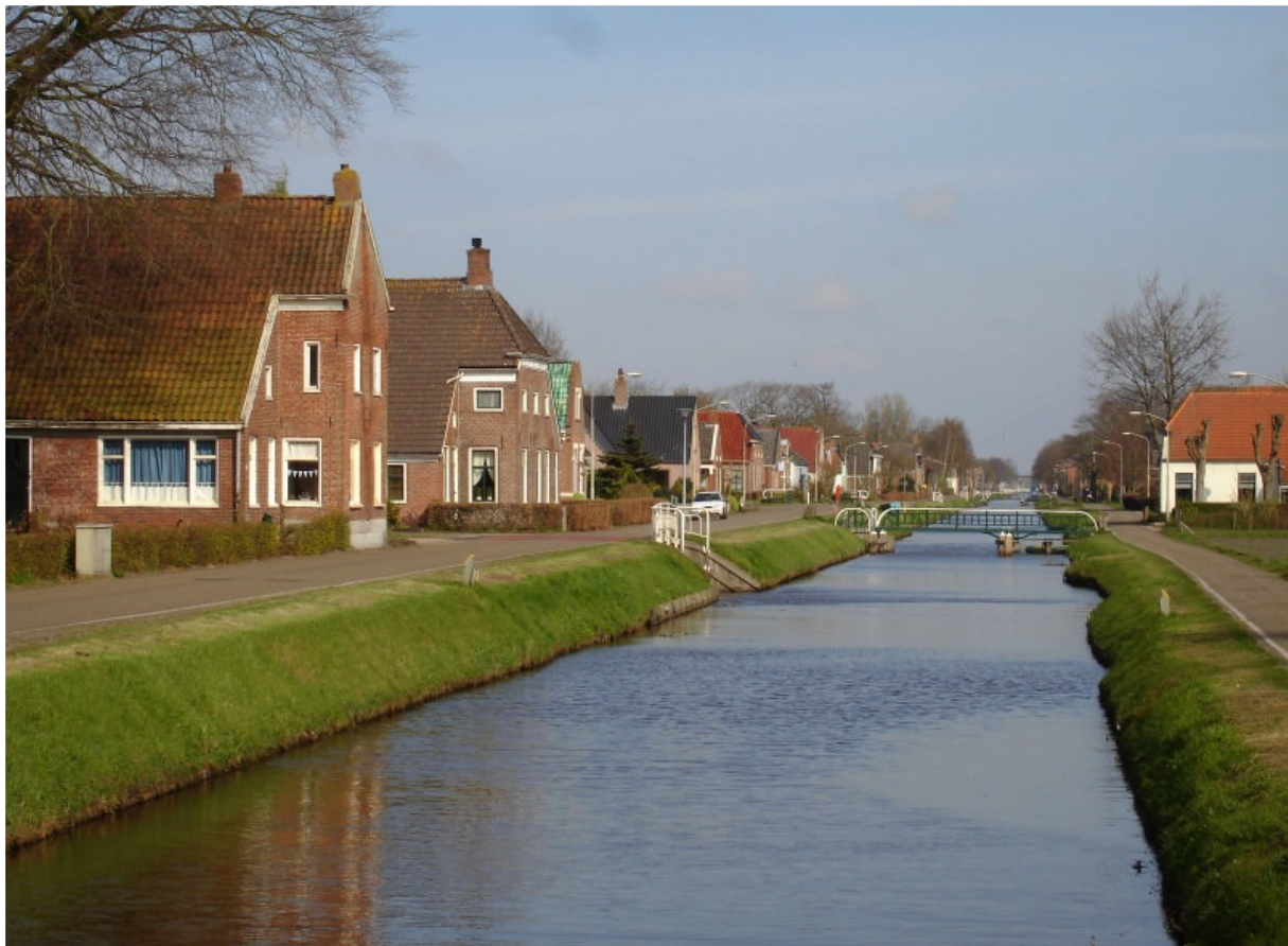
Afbeelding 5.1: Het Kieldiep

Bewoners van Kiel-Windeweer beschouwen het Kieldiep verreweg als het belangrijkste onderdeel van het dorp. Dit kanaal is daarmee het belangrijkste onderdeel bij de constructie van de identiteit van Kiel-Windeweer. Zonder uitzondering geven bewoners aan dat ze bij Kiel-Windeweer direct denken aan het Kieldiep.