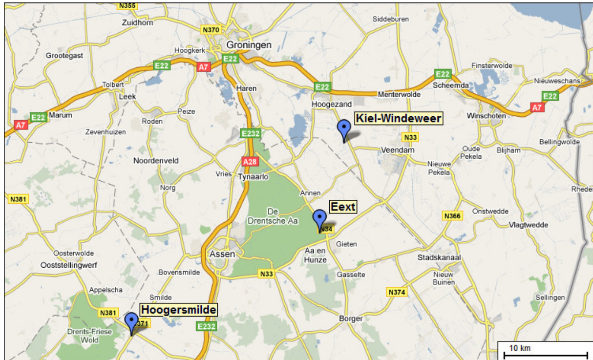
Afbeelding 4.1: De locaties van Kiel-Windeweer, Eext en Hoogersmilde (GoogleMaps, 2008)