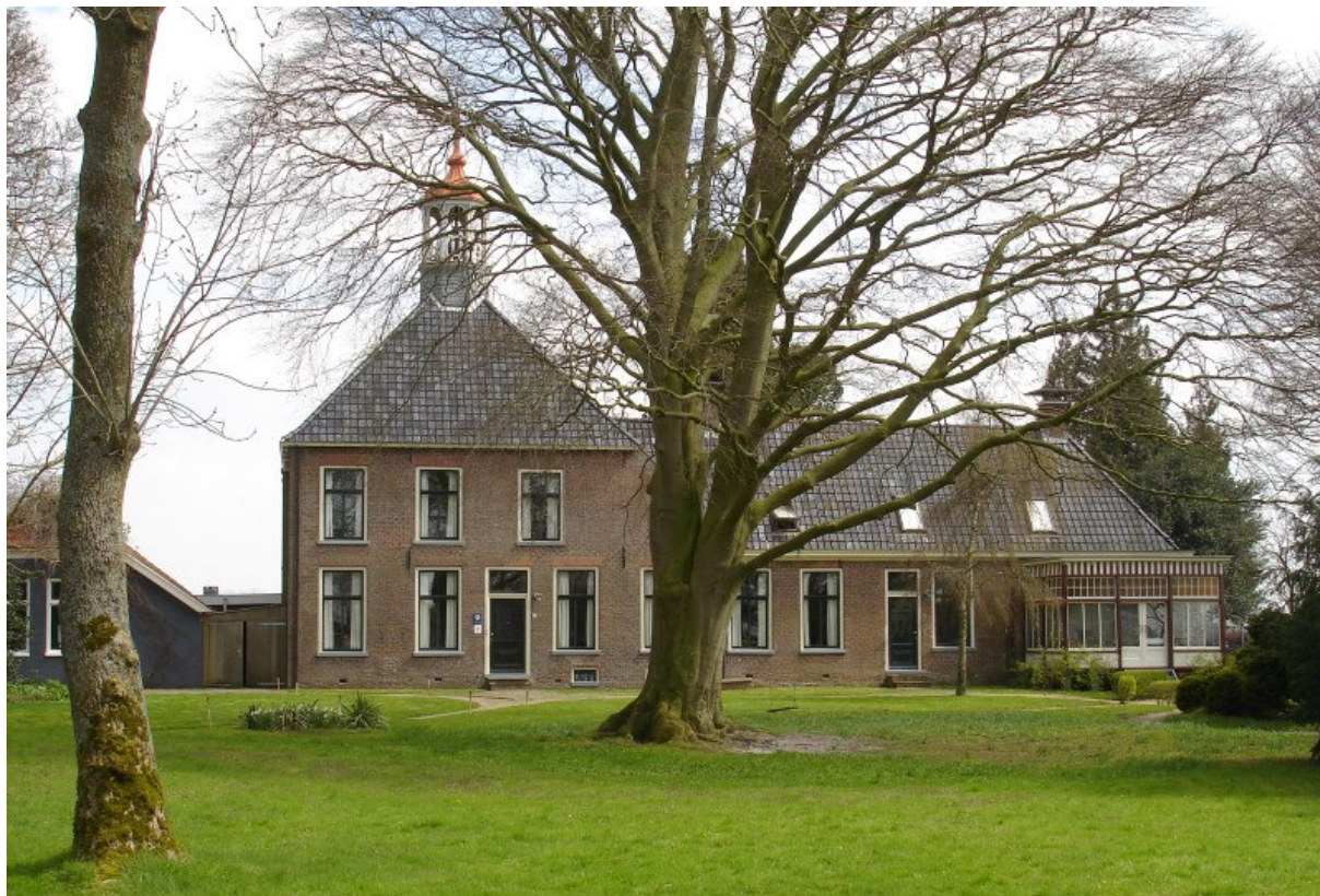
Afbeelding 5.3: De Amshoff

De Amshoff blijkt een behoorlijke invloed te hebben op de identiteit. 61% van de inwoners geeft aan dat dit pand van invloed is op de identiteit van Kiel-Windeweer. Hierbij bestaat een significant lineair verband tussen opleidingsniveau en identity marker De Amshoff . Hoger opgeleide inwoners geven aan meer aan De Amshoff te denken dan lager opgeleiden.