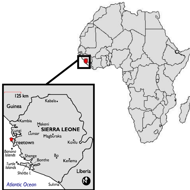
Figuur 3.1 Kaart van locatie Sierra Leone