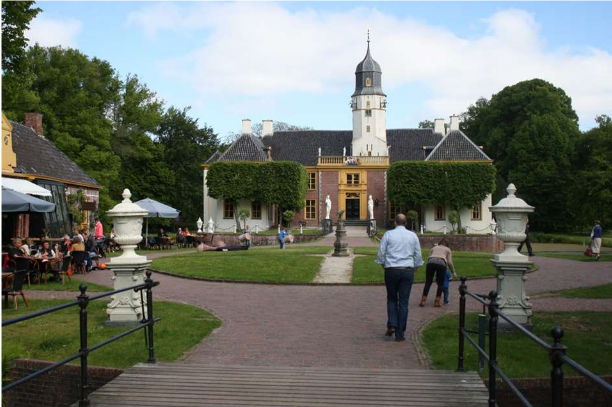
Figuur 1 - Fraeylemaborg