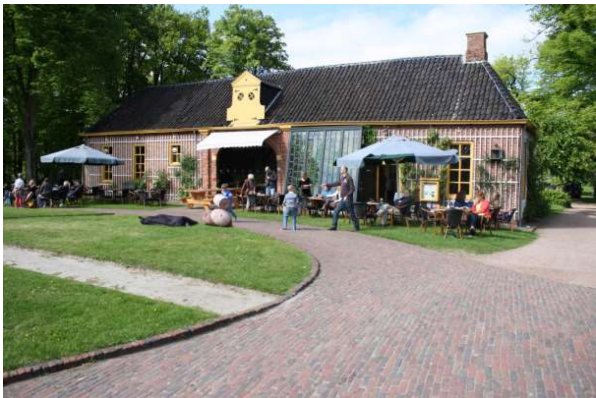
Figuur 2 – Schathuis