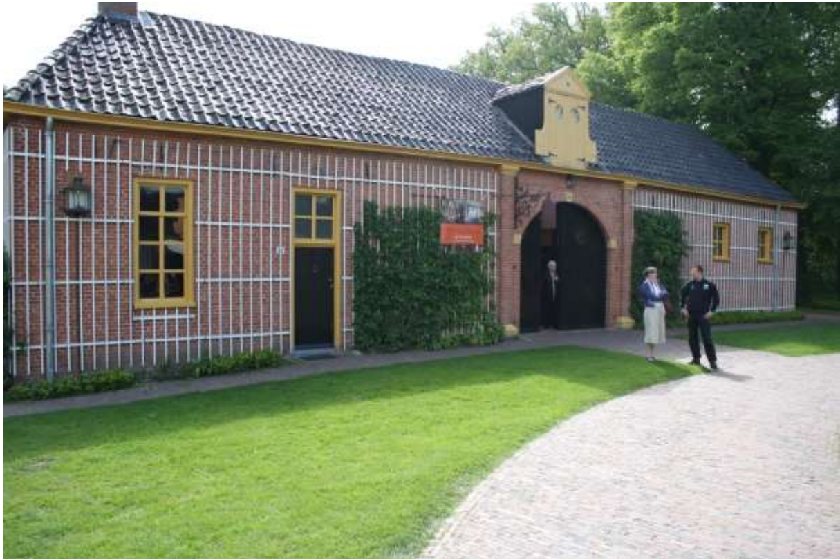
Figuur 3 – Koetshuis