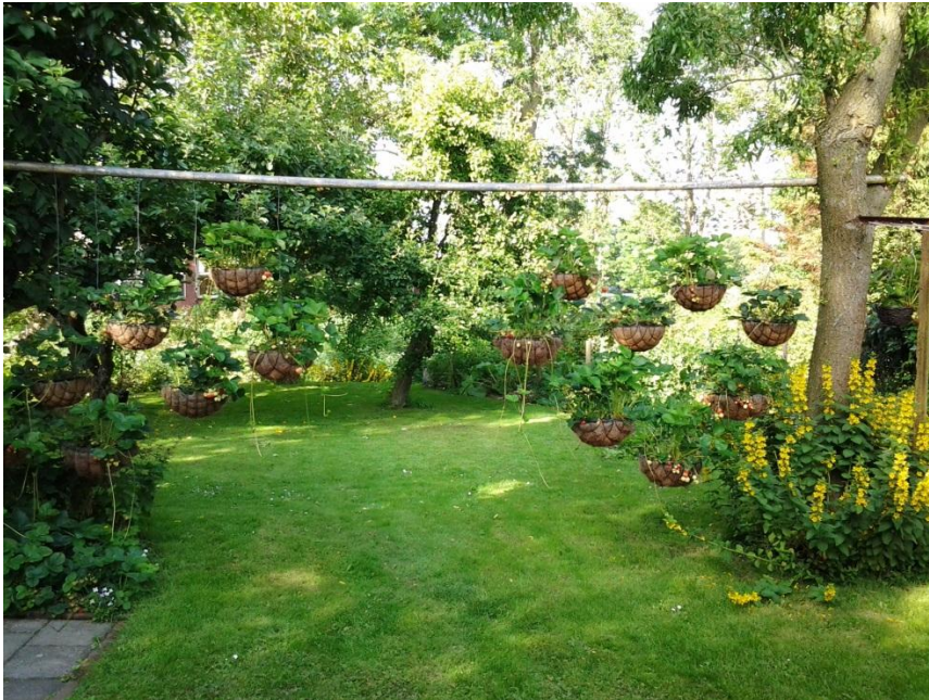
Figuur 4.6 Aardbeienmanden.

Greetje merkt op dat niet alleen zij graag aardbeien uit haar tuin eet, maar ook de slakken: