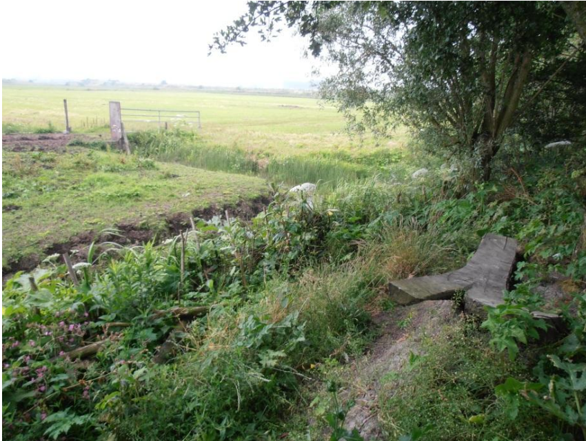
Figuur 4.7 Uitzicht.

Naast dat Bodhi met de grens van haar tuin kiest hoe veel wind zij in haar tuin wil hebben, is deze grens ook een verbinding met het weiland buiten haar tuin: