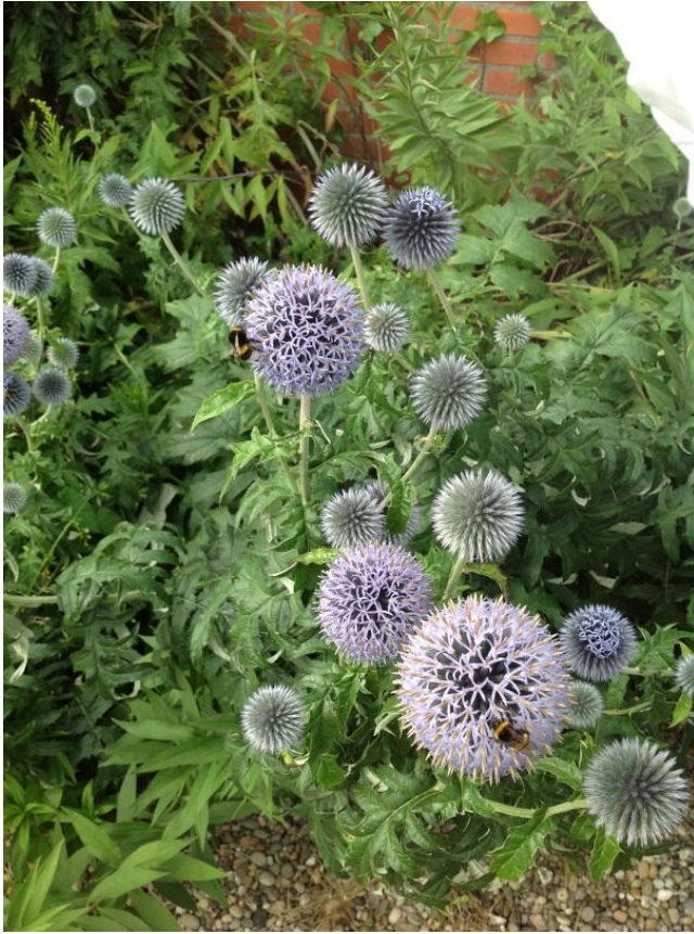
Figuur 4.5 Hommelplant.

“Dit zijn kaardenbollen. Er zitten hommels op. Dat is heel leuk om te zien. Dat zoemt dan, zo’n plek. Het is zonde dat je een foto hebt, want hier hoort eigenlijk een geluid bij. (...) Het is zomers en rustig. (...) Het is een goed gevoel. (...) Daarom heb ik ze gestekt en ook op andere plekken neergezet.” – Franziska