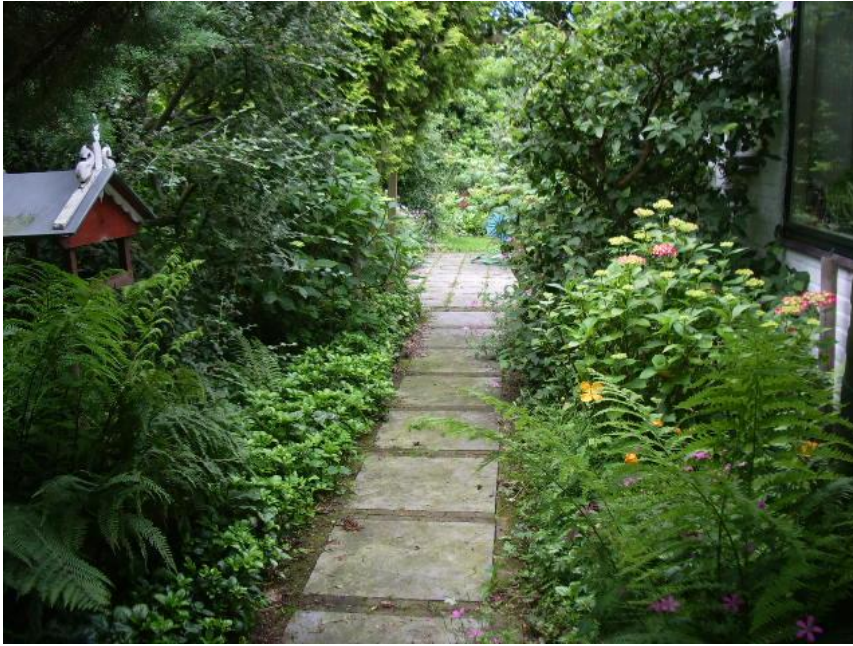
Figuur 4.12 Vogelhuisje.

“Het pad langs het huis met een vogelhuisje. Dat is een belangrijk element in de winter. Je wilt niet weten welke vogels daar komen foerageren! Dat heeft een mooi gevoel. Ook een groot gevoel voor die vogels, dat zij het zonder verwarming buiten kunnen overleven en wij achter het glas, alleen maar met verwarming aan daarvan kunnen genieten.” – Henk