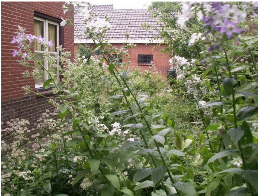
Figuur 4.4 Zichtlijn.

Het zintuig ‘zicht’ is het meest besproken zintuig als het gaat om de beleving van de tuin. Door te kijken, kunnen mensen grote delen van hun tuin overzien. Ook wordt het zien veel geassocieerd met een betovering door de omgeving. Flora maakt met de onderstaande foto (figuur 4.4) duidelijk hoe zij haar tuin beleeft door te kijken: