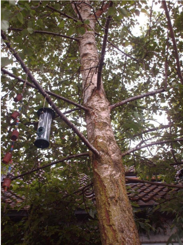
Figuur 4.10 Berk.

(Chain 3). Daantje maakt met figuur 4.10 en het onderstaande citaat duidelijk wat haar interactie met de niet-menselijke actor ‘berk ‘ is: