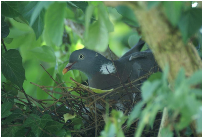
Figuur 4.11 Houtduif.

Ook in het volgende voorbeeld wordt duidelijk hoe de tuinier door een niet-menselijke actor wordt overgehaald om af te wijken van zijn plannen: