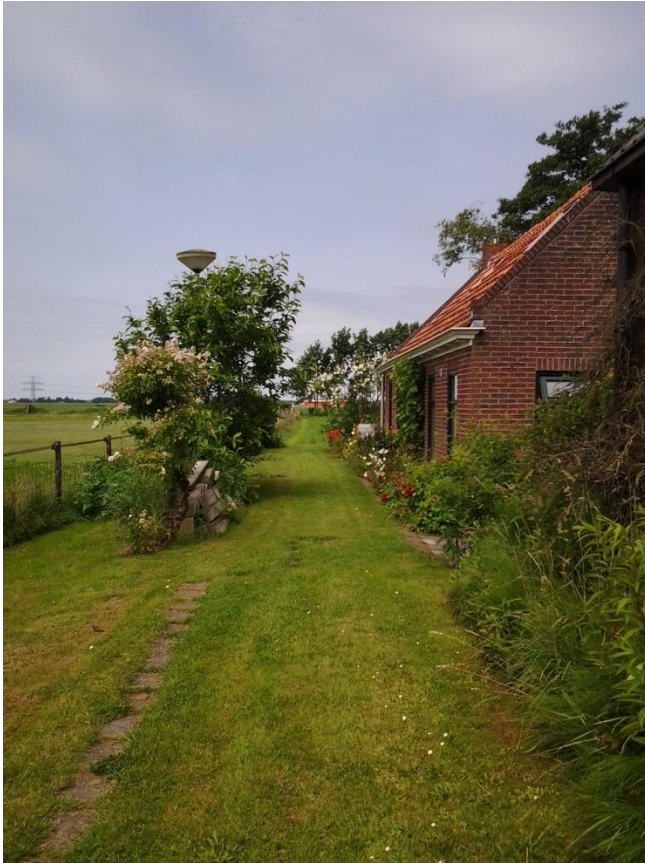
Figuur 4.2 Thuis. Foto: Greetje

“Dit is een heel belangrijke (foto, red.). Gewoon hier dit pad op rijden: het eind van de wereld. Daar staan dan mijn huis en mijn tuin. Dit staat voor thuis, ruimte, rust. Je goed voelen. (...) Dat ik thuiskom en dat ik denk, goh, dat ik daar mag wonen!” – Greetje