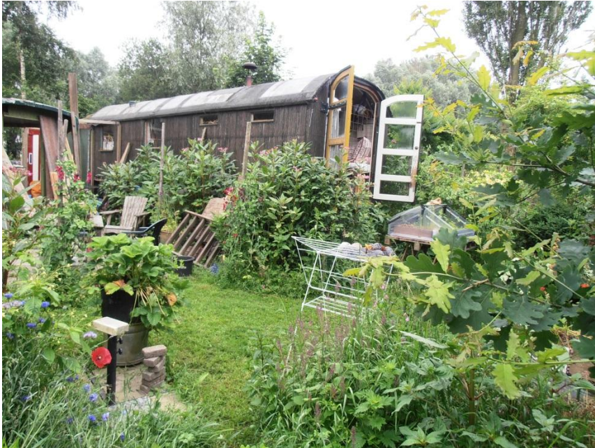
Figuur 4.1 Vrijheid.

“Ik merk ook dat ik veel minder de behoefte heb aan vakantie enzo. Ik hoef niet meer zo weg. Ik zeg ook altijd tegen anderen: ik kampeer het hele jaar. En zo voelt het ook. Het is een vrijheid die ik van kamperen en reizen en dat soort dingen ken. Ik ga wel eens weg, maar ik merk dat die behoefte steeds meer afneemt. Dus ik voel me hier echt thuis.” – Bodhi