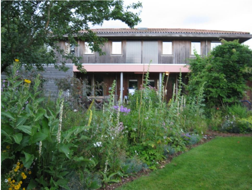
Figuur 4.8 Eenheid.

P.: “Dit is een mooie plaat hoe natuur en cultuur samen kan gaan. Hoe een huis opgenomen wordt door een tuin, een eenheid kan zijn. Als je de rest van de straat ziet... dan is dat niet waar veel mensen oog voor hebben, of dat niet willen...”