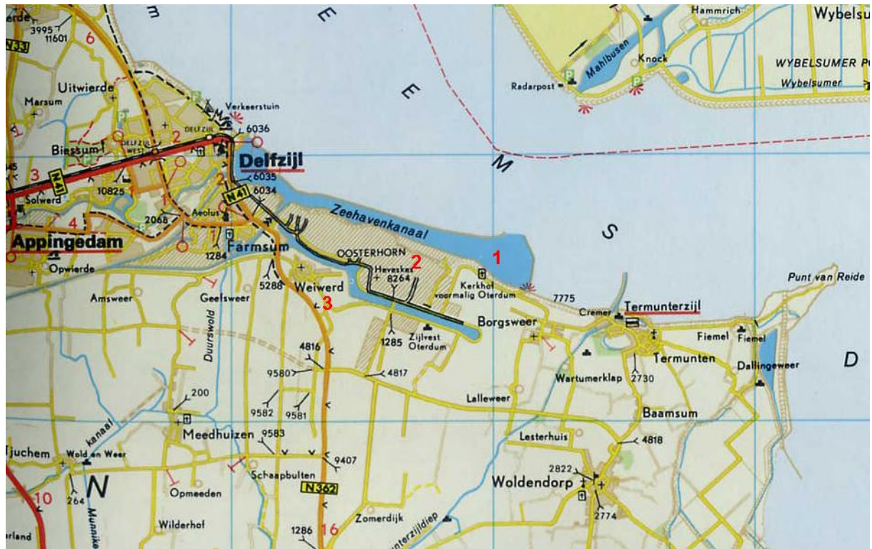
Figuur 1.1 De ligging van Delfzijl en van de drie verdwenen dorpen.