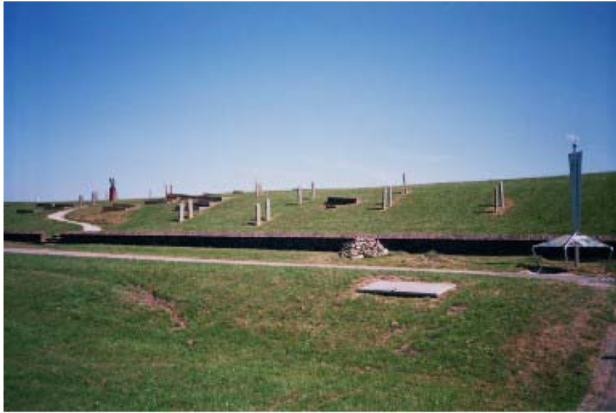
Heveskes, Weiwerd en Oterdum: Verdwenen, maar (nog) niet weg