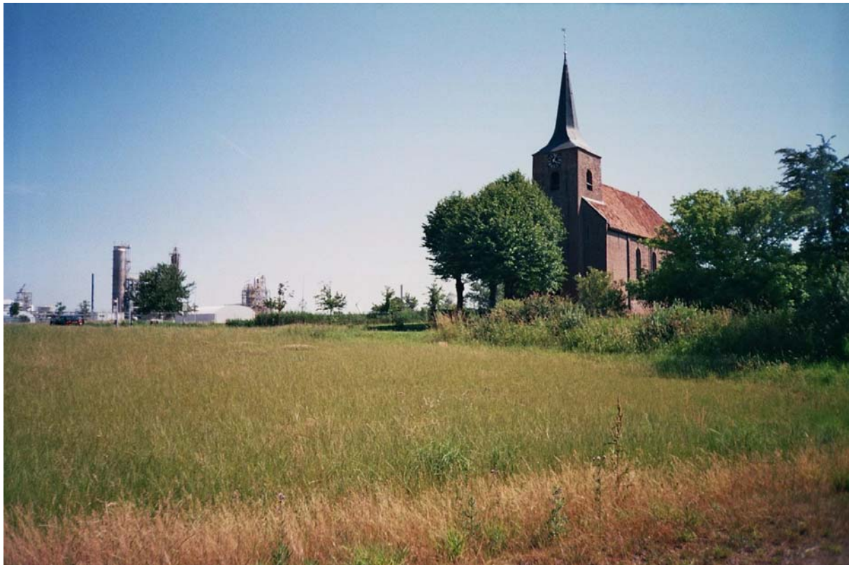
Afbeelding 6.1 De kerk in Heveskes met op de achtergrond het industrieterrein.