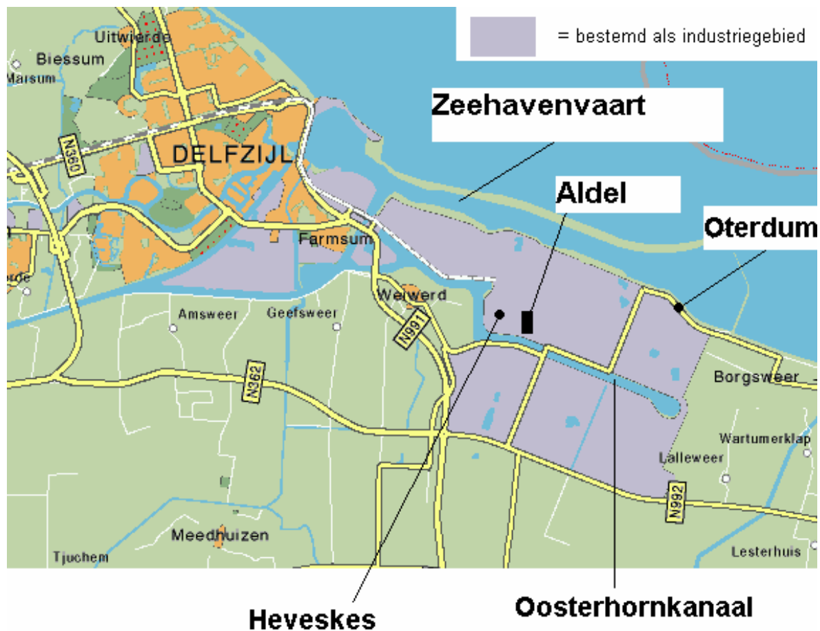
Kaart 6.1 De omgeving van Delfzijl.