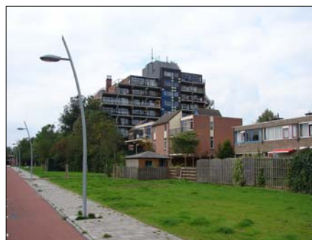
Figuur 3.2: Beeld uit Lewenburg