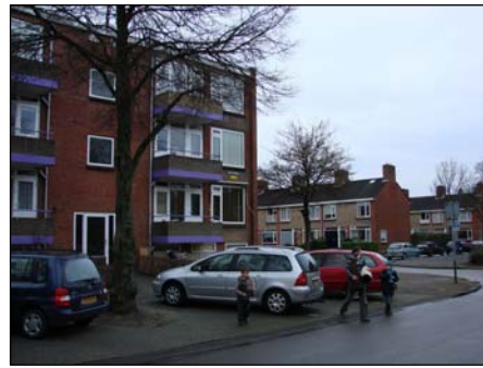
Figuur 3.4: Beeld uit de Wijert-noord