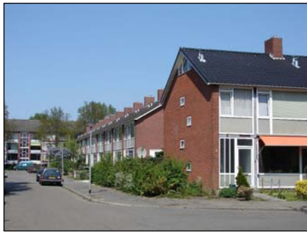
Figuur 3.3: Beeld uit Selwerd