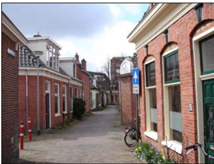
Figuur 3.5: Beeld uit de Oosterpoort