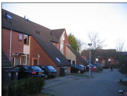
Figuur 3.1: Beeld uit Beijum

Een drietal paren is gekozen van twee wijken die op het eerste oog veel overeenkomsten vertonen en waarvan globaal genomen een vergelijkbaar beeld bestaat. Hier wordt het beeld bedoeld dat leeft bij medewerkers die betrokken zijn bij het project Onderscheidende Wijken. De drie paren die zijn gekozen zijn: Beijum & Lewenburg, Selwerd & de Wijert-noord en de Oosterpoort & de Schildersbuurt. Hieronder is van elke wijk een karakteristieke foto weergegeven.