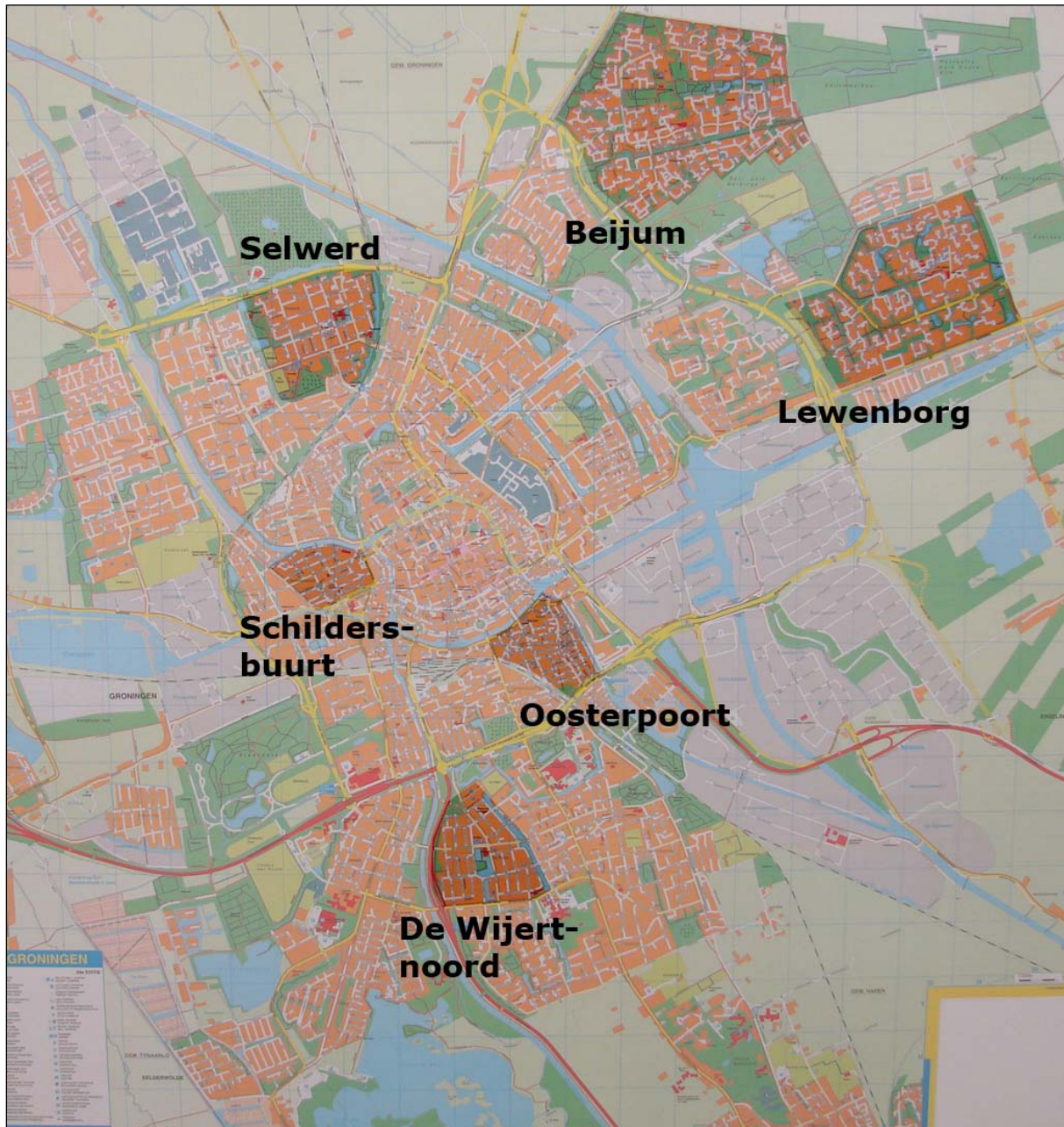
Figuur 3.7: ligging en afbakening van de casewijken in de stad