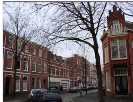
Figuur 3.6: Beeld uit de Schildersbuurt

Er is onderscheid gemaakt naar variatie in het percentage woningen in corporatief bezit. Dit is gedaan omdat wijken met veel huurhuizen het over het algemeen minder goed doen dan wijken met een hoog percentage koopwoningen. Dit blijkt onder andere uit het feit dat herstructureringswijken vrijwel altijd wijken zijn met een hoog percentage huurwoningen (van Kempen & Priemus 1999). Bovendien gaat een hoger percentage corporatief bezit gepaard met een lager gemiddeld inkomen en dit zorgt voor een kwetsbaardere maatschappelijke positie van de bevolking. Daarnaast is een woningbouwcorporatie een actor die veel invloed kan uitoefenen in een wijk, zowel op de gebouwde/te bouwen fysieke omgeving als op de selectie van mensen die er (gaan) wonen (zie paragraaf 2.1 over 'macht en identiteit').