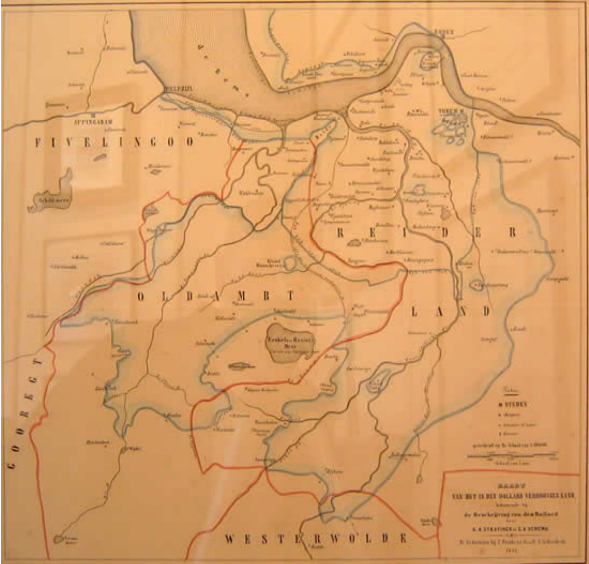
Figuur 6: De situatie voor het ontstaan van de Dollard