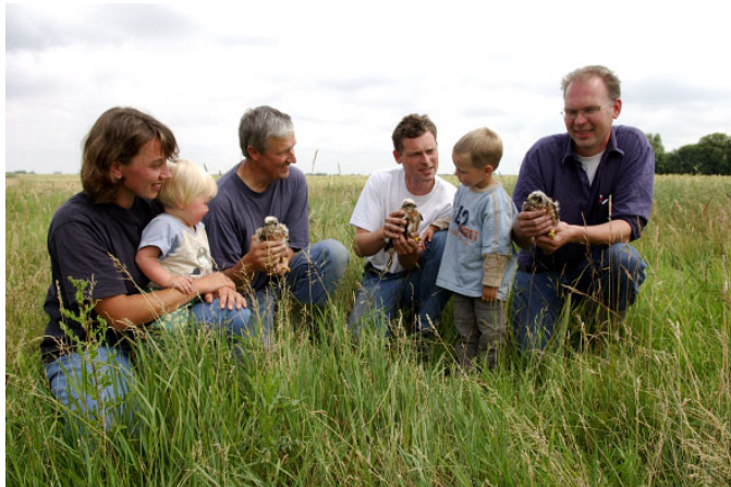
Figuur 4 Het ringen van jonge Grauwe kiekendieven in het Oldambt; educatie aan jong en oud

Het ringen van de kuikens onder leiding van vogelaars van de Werkgroep Grauwe Kiekendief heeft bij veel agrariërs de affiniteit voor fauna versterkt.