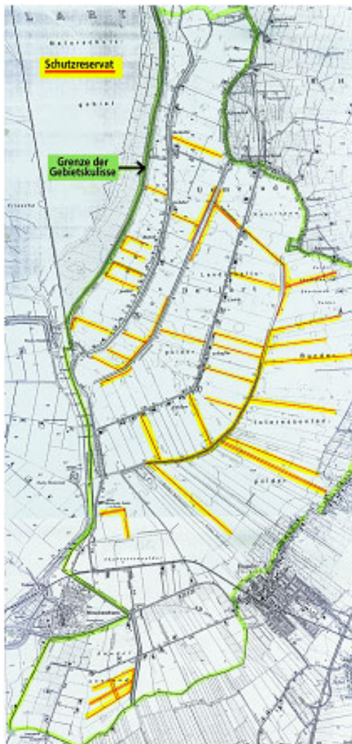
Figuur 3 Faunارانenproject (Ackerstreifenprogramm) in de Rheiderländer Marsch. Groen = begrenzing gebied, Geel = faunارانen

Het plan bestaat uit een dooradering van de Marsch door middel van faunارانen (in het Duits Ackerstreifen) In het midden van het gebied is een grote 'hoofdader' aangelegd, met zijtakken de verschillende polders in (zie figuur 3)