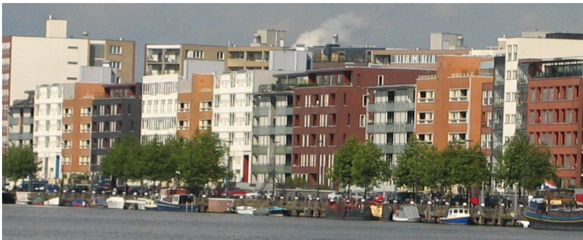
afbeelding 6.1: Oostelijk Havengebied Amsterdam

Omdat het verdiept aanleggen van een deel van de Hondsrugweg een dure ingreep is zou er ook voor een andere oplossing kunnen worden gekozen. Er zouden één of meerdere brede zebrapaden over de Hondsrugweg kunnen worden gemaakt, met speciale voetgangersstoplichten. Hierdoor worden ook de oost-west verbindingen benadrukt. Het nadeel van deze ingreep is echter wel dat voetgangers en automobilisten elkaar hinderen, omdat ze omstebeurt moeten wachten op elkaar.