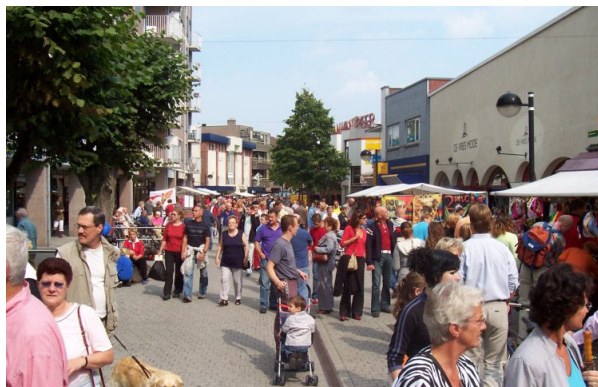
afbeelding 4.4: Centrum Noord

Het centrum wordt door alle bezoekersgroepen overwegend positief beoordeeld. Vooral over de sfeer van het centrum zijn de ondervraagden over het algemeen positief. De meerderheid van de respondenten vindt het centrum gezellig, sfeervol en levendig (bijlage 4.1, 4.2). Een deel van de mensen vindt wel dat het centrum te langgerekt en onsamenhangend is (Kenniscentrum Drenthe, 2001).