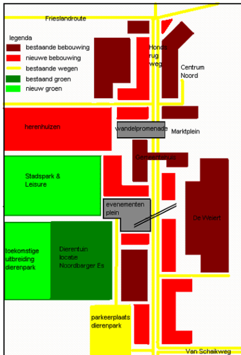
afbeelding 6.2: voorstel ruimtelijke invulling gebied rond de Hondsrugweg

In plaats daarvan kan Emmen in het streven naar een meer stedelijke en samenhangende uitstraling van het centrum beter voor de 'gulden middenweg' kiezen. De middelhoge complexen aan de noordkant van het Marktplaats zijn hier een goed voorbeeld van. Qua maatvoering sluiten deze gebouwen van 6 bouwlagen goed aan op de afmetingen van het plein en vallen ze niet echt uit de toon bij de omliggende lagere gebouwen, maar het zijn toch typisch stedelijke gebouwen. In Centrum Noord zou ook naar een dergelijke maatvoering moeten worden gestreefd. Als delen opnieuw worden ontwikkeld, zou er als eis moeten worden gesteld dat de nieuwe gebouwen maximaal 5 bouwlagen hoog mogen zijn. Hierdoor kan er een typisch stedelijke sfeer ontstaan, maar vallen de nieuwe gebouwen niet te sterk uit de toon bij de bestaande bebouwing.