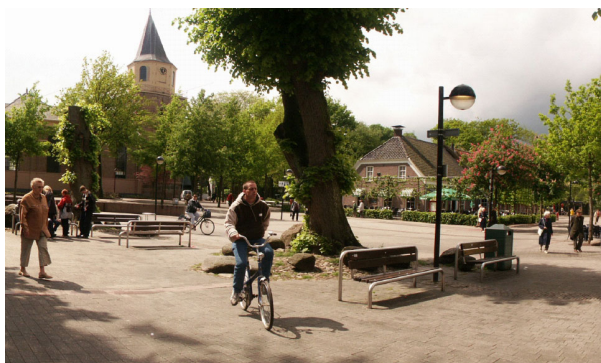
afbeelding 4.2: het Marktplein