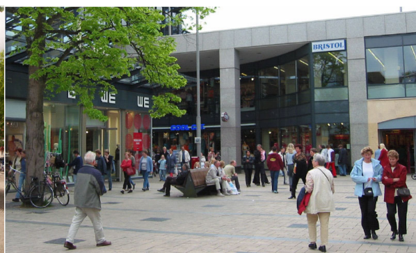
afbeelding 4.3: winkelcentrum de Weiert