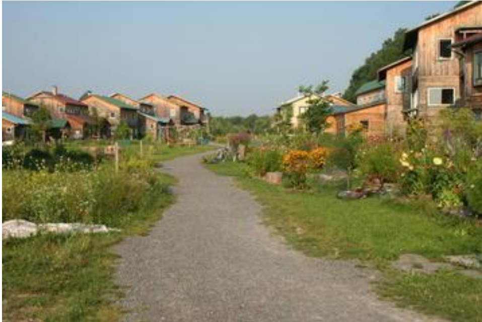
Afbeelding 3.1 Voorbeeld van een rurale ecologische woongemeenschap op Lesbos.