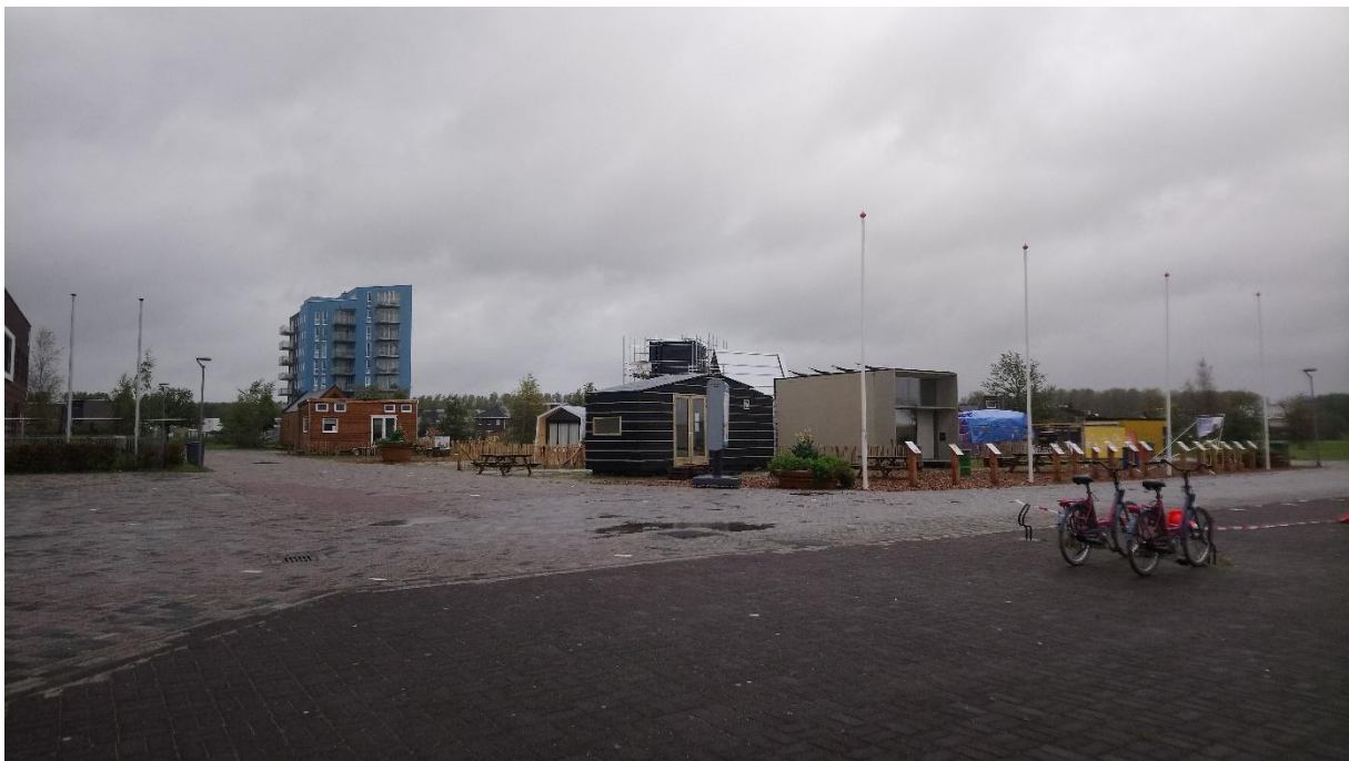
Afbeelding 5.9 Tiny Housing BouwExpo als voorbeeld van een tiny house woonlocatie in stedelijk gebied.