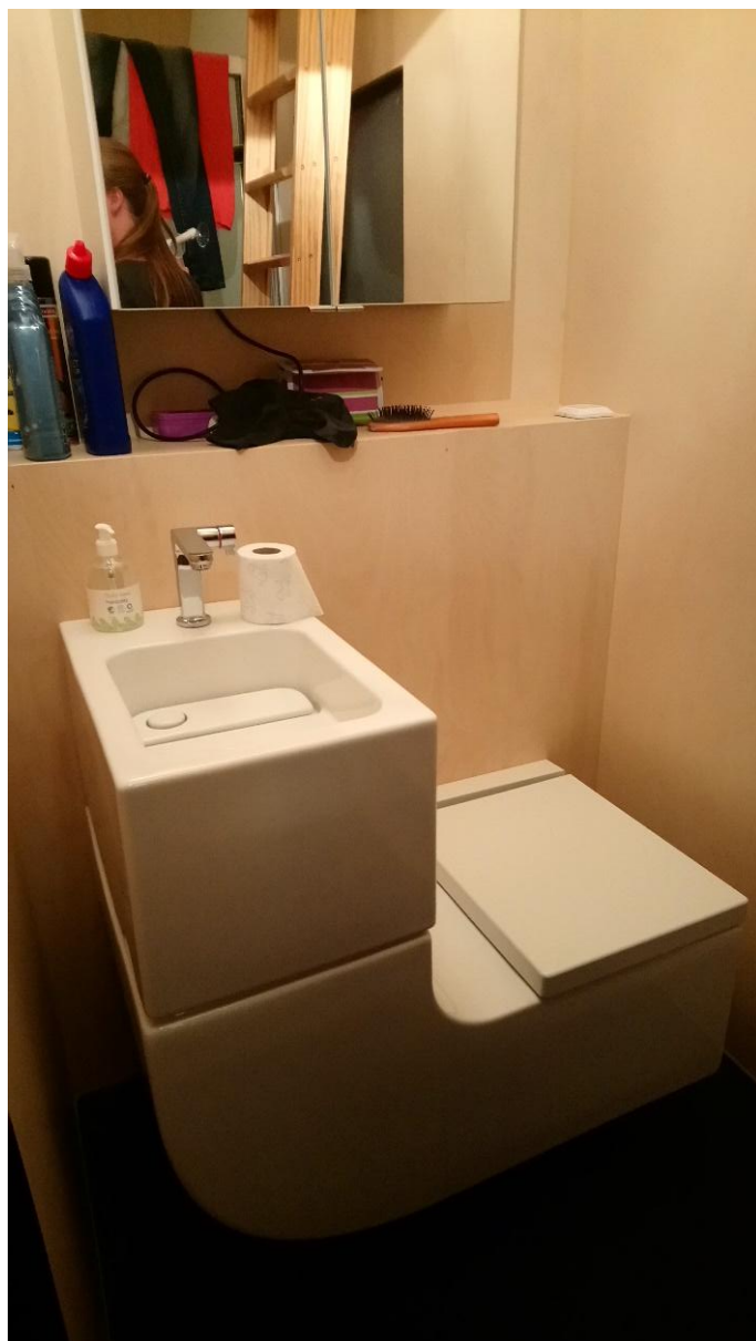
Afbeelding 5.5 Waterbesparend toilet in een on-grid tiny house.