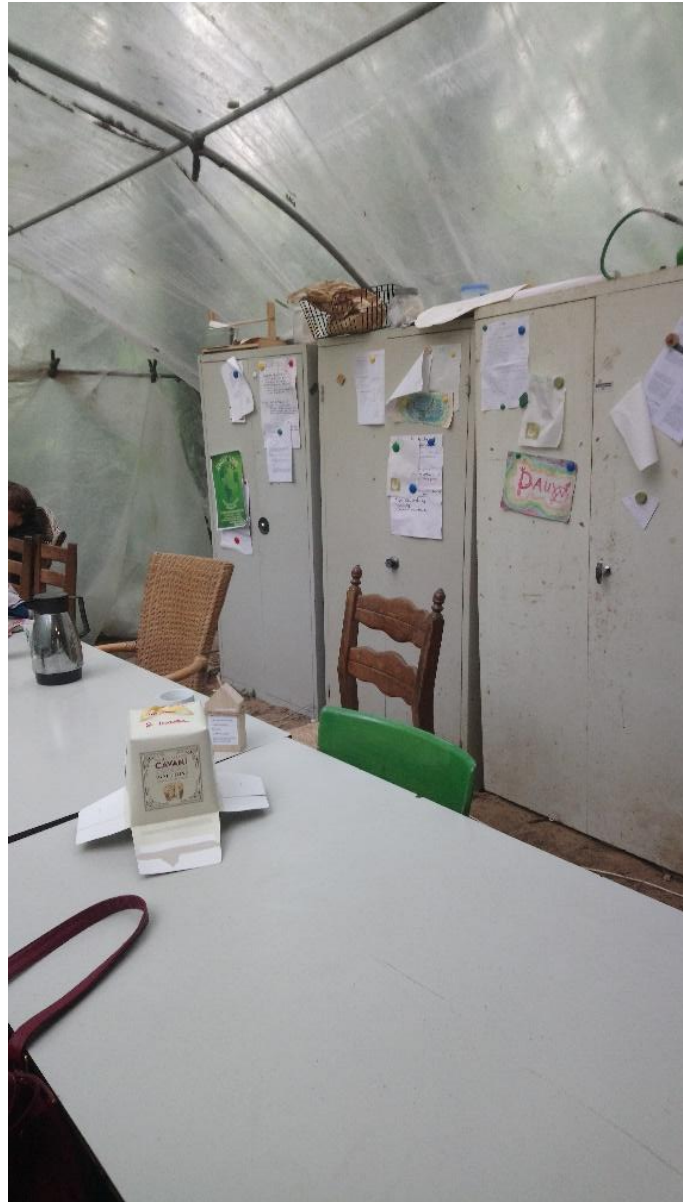
Afbeelding 4.1 Interviewsetting binnen de gemeenschappelijke ruimte op het woonterrein van een respondent.