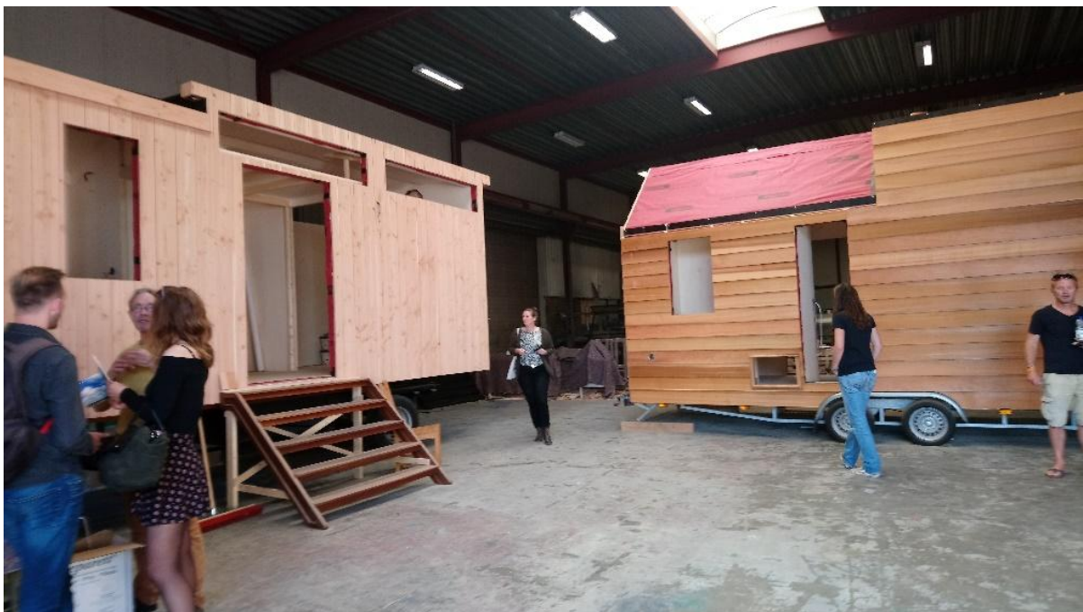
Afbeelding 2.2 Voorbeeld van een lokaal georganiseerde 'open dag' door tiny house bewoners, die ik in september 2017 bezocht. Tijdens deze open dag kregen geïnteresseerden informatie over tiny house-living en was er daarnaast de mogelijkheid om verschillende typen tiny houses te bezichtigen.

Mede naar aanleiding hiervan werd in 2016 het eerste tiny house in Nederland gerealiseerd in Alkmaar, met hulp van sponsors en media aandacht, waarna meer tiny house initiatieven door het hele land volgden, zowel van particulieren als andere initiatiefnemers. Ook werd er een algemene Facebook community voor en door (toekomstige) tiny house bewoners in het leven geroepen, genoemd naar het samenwerkingsverband 'Tiny House Nederland', die in september 2018 ruim 25.000 leden telde. Volgens Woonpioniers (2016) noemt de eerste generatie tiny house bewoners in Nederland zichzelf ook wel 'pioniers', zoals ik ook ondervond bij de respondenten binnen het onderzoek, omdat zichzelf als de eerste vertegenwoordigers van tiny house-living in Nederland beschouwen. Activiteiten die de leden van de tiny house beweging in Nederland ondernemen zijn onder meer het organiseren van evenementen, lezingen en open dagen om andere geïnteresseerden te inspireren en enthousiasmeren voor tiny house-living, om zo maatschappelijk draagvlak te creëren voor tiny housing als legale woonvorm in Nederland (zie afbeelding 2.2).