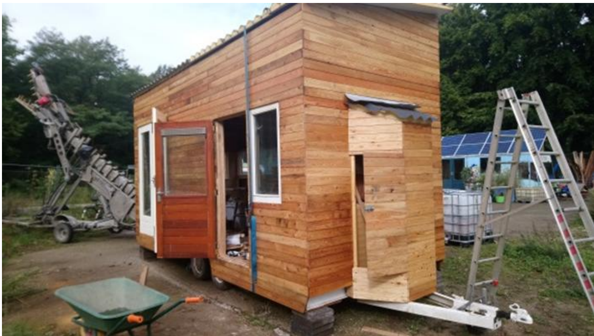
Afbeelding 5.6 Voorbeeld van een mobiel tiny house gebouwd op een trailer.