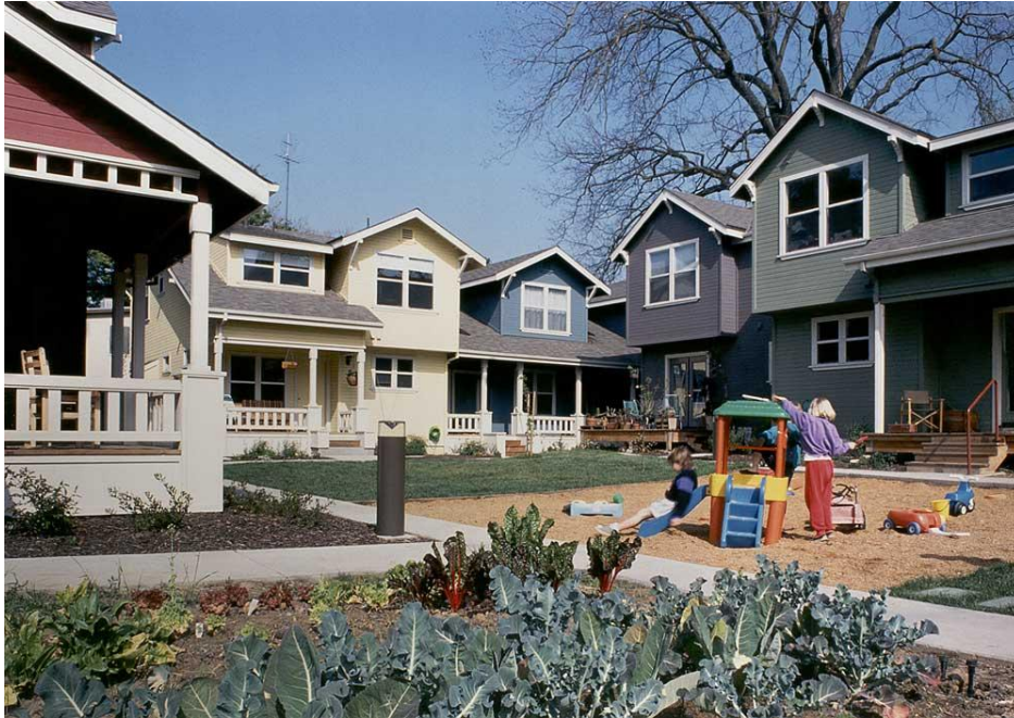
Afbeelding 3.3 Voorbeeld van een cohousing initiatief in de Verenigde Staten.