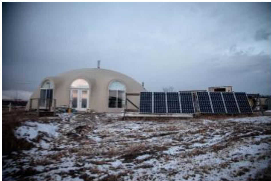
Afbeelding 3.2 Een off-grid woning in Canada.