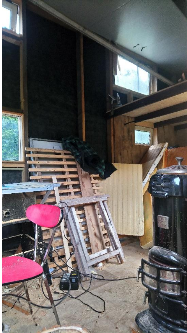
Afbeelding 5.12 Voorbeeld van een tiny house in aanbouw.