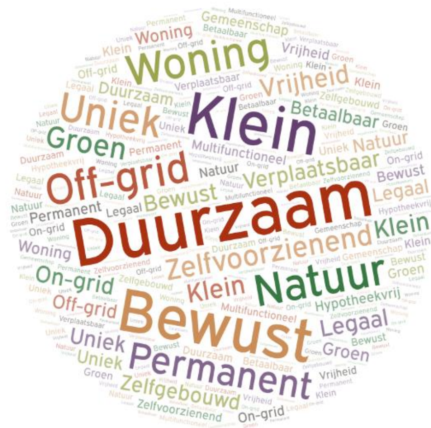
Afbeelding 2.1 Wordcloud waarin de belangrijkste aspecten van een tiny house, volgens de veertien respondenten binnen het onderzoek, zijn opgenomen. De grootte van de woorden/aspecten duiden hier op de mate van frequentie waarin het aspect genoemd werd binnen de definitie van een tiny house door de (toekomstig) bewoners. Hieruit blijkt dat belangrijke elementen van hun definitie van een tiny house onder meer waren: 'duurzaamheid', 'klein wonen' en 'het bewust kiezen'.