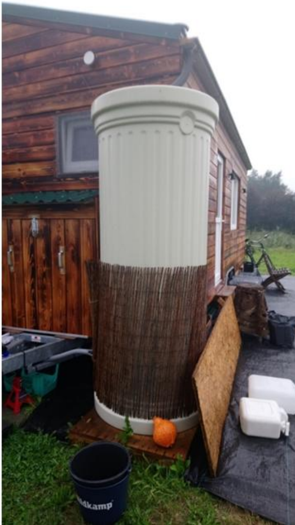
Afbeelding 5.2 Opslagtank voor regenwater bij het off-grid tiny house. (Bron: Judith Antonides, 2017)

In Meijering et al. (2007) is het zelf voorzien in elektriciteit en voeding ook terug te zien bij de bewoners van plattelands hippy gemeenschappen, waaronder de Hobbitstee in Nederland. De bewoners van dit type gemeenschappen hingen net als de (toekomstig) tiny house bewoners die off-grid woonden, een alternatieve manier van leven aan, waarbij het zorgen voor het milieu en zelfvoorzienend leven belangrijke ideologische doelstellingen onder hen waren (Meijering et al., 2007).