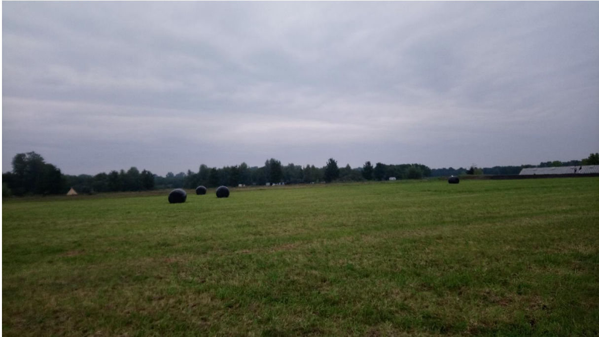
Afbeelding 5.8 Landgoed als voorbeeld van een 'groene' tiny house woonlocatie in meer afgelegen gebied.