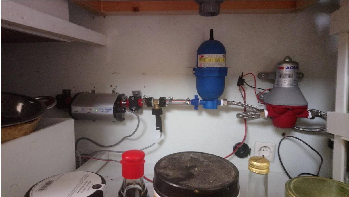
Afbeelding 5.4 Filtreermechanisme en pomp voor regenwater.

Daarentegen waren de on-grid tiny houses van een viertal respondenten binnen het onderzoek wel op het algemene waternet, elektriciteitsnet en rioleringsstelsel aangesloten (zie ook Woonpioniers, 2016). Bij dit type tiny houses stond voornamelijk de doelstelling energieneutraal wonen centraal, vaak in combinatie met moderne technologieën zoals een waterbesparend toilet (zie afbeelding 5.5). De inbouw van een waterbesparend toilet droeg bijvoorbeeld bij aan een vermindering van het waterverbruik, omdat het toilet automatisch doorgespoeld kon worden met gebruikt water vanuit de wasbak. Energie werd daarnaast ook (grotendeels) opgewekt door middel van zonnepanelen, waarbij de opgewekte energie soms ook kon worden opgeslagen in accu's (Mill Home, 2018b). Daarbij werd energieverbruik onder on-grid tiny house bewoners bijvoorbeeld (indirect) teruggedrongen door de aanleg van goede isolatie en de toepassing van opgeslagen zonne-energie. In Vannini & Taggart (2013) komt naar voren dat de toepassing van dergelijke technologieën, waaronder zonnetechnologie en een waterbesparend toiletsysteem, beschouwd kan worden als een passieve wijze waarop alternatieve energieopwekking en waterbesparing wordt nagestreefd door bewoners. Zo stellen ze dat on-grid bewoners zelf geen onderdeel uitmaken van bijvoorbeeld warmteprocessen in hun woning, in tegenstelling tot off-grid bewoners.