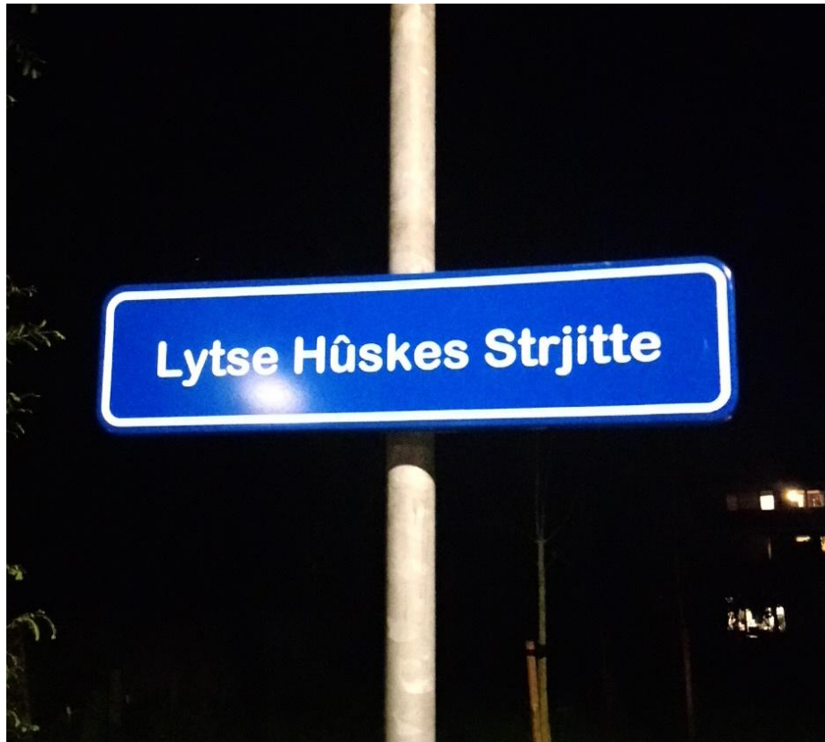
Afbeelding 2.3 De bewoners van het eerste 'tiny house straatje' in Hardegarijp (Friesland) kregen met behulp van de gemeente de bovenstaande officiële straatnaam toegewezen.

Binnen de huidige en nieuwe regelgeving zijn echter meer mogelijkheden gekomen voor tiny housing in het algemeen. Zo zal er binnen de nieuwe Omgevingswet (2021) meer ruimte zijn voor particuliere initiatieven (Rijksoverheid, 2018b), waaronder bijvoorbeeld de aanvraag voor een legale woonlocatie vanuit een lokale tiny house initiatiefgroep, waarbij de desbetreffende gemeenten hier op maat op kunnen anticiperen. Ook worden verschillende bijeenkomsten en evenementen vanuit overheid en gemeenten georganiseerd, zoals het 'Lutje Hoeskes evenement' dat op 23 september 2017 in Groningen plaatsvond. Het doel was in dialoog te gaan met (toekomstige) bewoners over de mogelijkheden rondom het realiseren van verschillende vormen van tiny housing in Nederland (zie afbeelding 2.4).