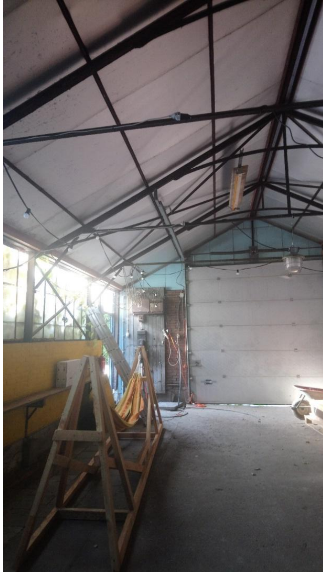
Afbeelding 5.10 Gezamenlijke werkplaats van een tiny house woongemeenschap, waar bewoners soms samen werken aan verschillende (bouw)projecten.