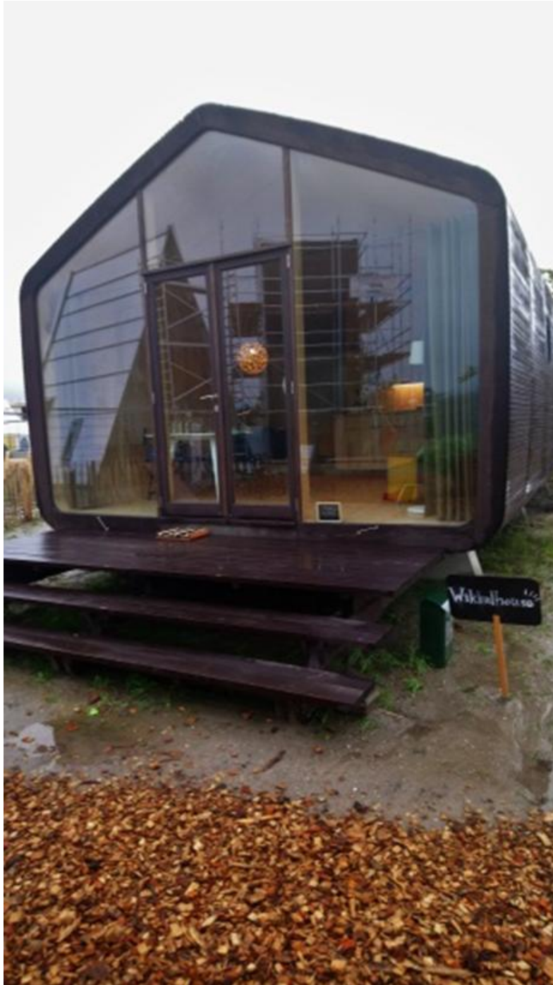
Afbeelding 5.7 Voorbeeld van een vaststaand tiny house.