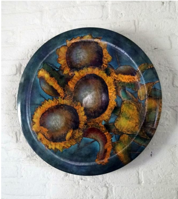
Afbeelding 5.13 Handgemaakte schaal die respondent Marnix tijdens één van zijn reizen als souvenir kocht. Deze kreeg een plek in zijn toekomstige tiny house.

In § 5.3.2 zal de identificatie met objecten uit het tiny house onder respondenten naar voren komen, als voorbeeld van een symbolische place-making activiteit.