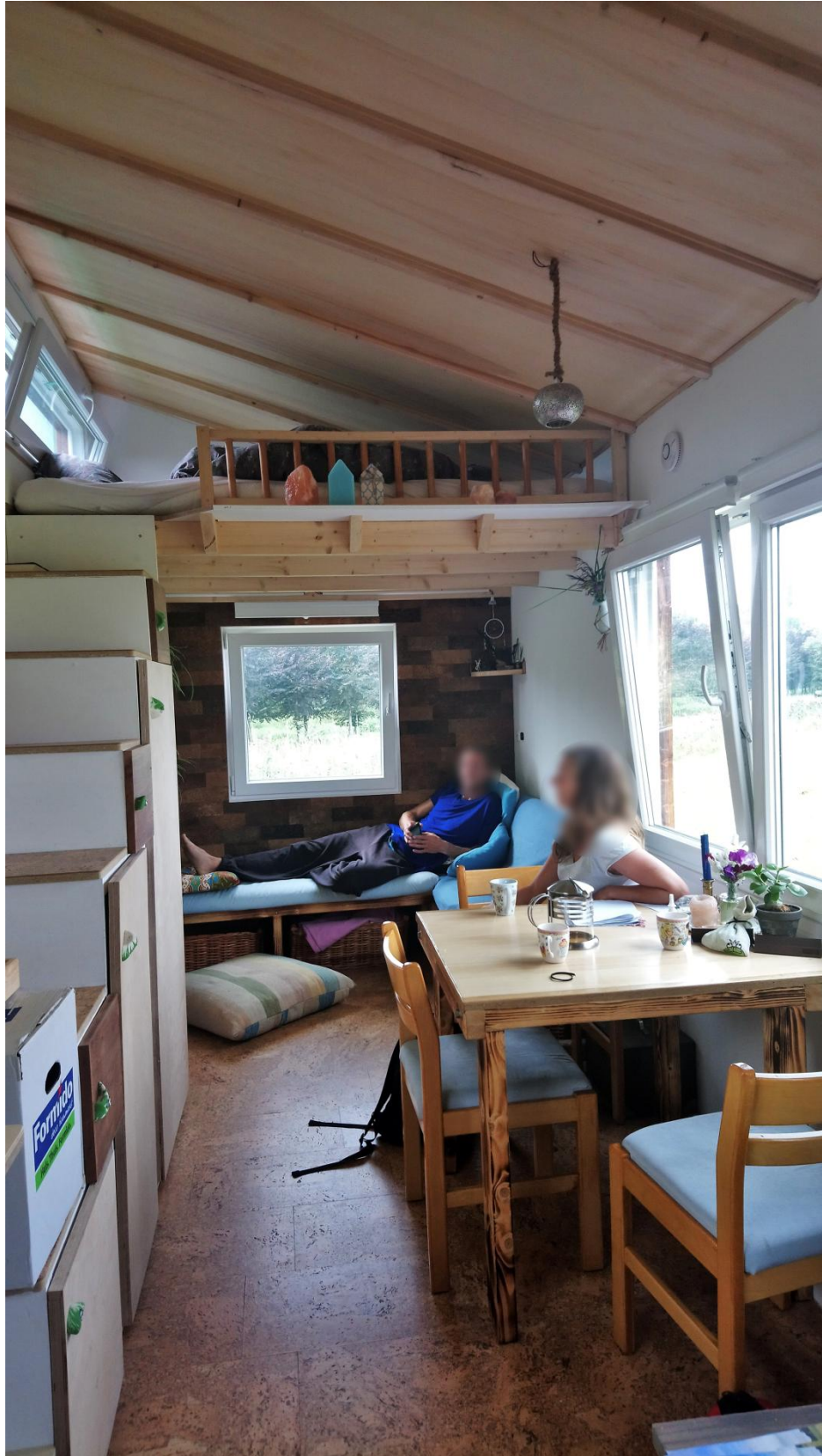
Afbeelding 1.1 Voorbeeld van een tiny house met multifunctioneel gebruik van de beschikbare woonruimte. Het slaap-, eet- en woongedeelte bevinden zich in dezelfde ruimte en de aanwezige meubels hebben meerdere functies. Zo dient de trap hier ook als boekenkast.