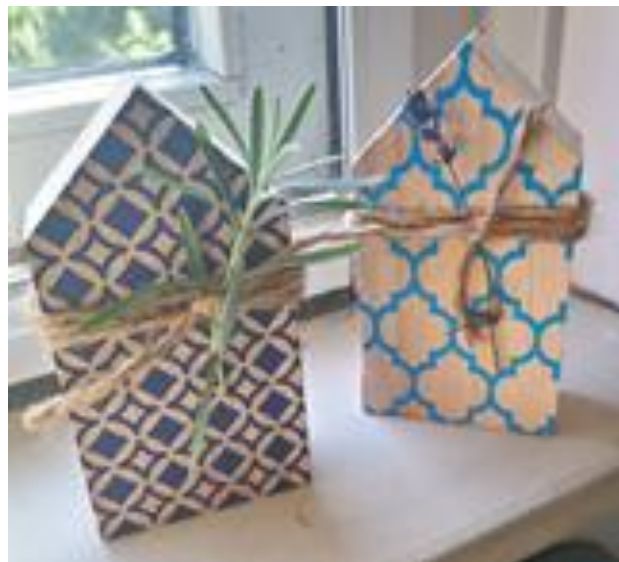
Afbeelding 4.2 Persoonlijke bedankjes voor respondenten.

Na afloop van het diepte-interview werd de informanten gevraagd of zij nog andere opmerkingen, vragen en/of feedback hadden die zij met mij wilden delen. Na deze besproken te hebben bedankte ik respondenten voor hun deelname aan het interview en gaf hen een persoonlijk bedankje gerelateerd aan het onderzoeksonderwerp (zie afbeelding 4.2). Ook werd met alle informanten afgesproken dat zij de uiteindelijke scriptie toegestuurd zouden krijgen.