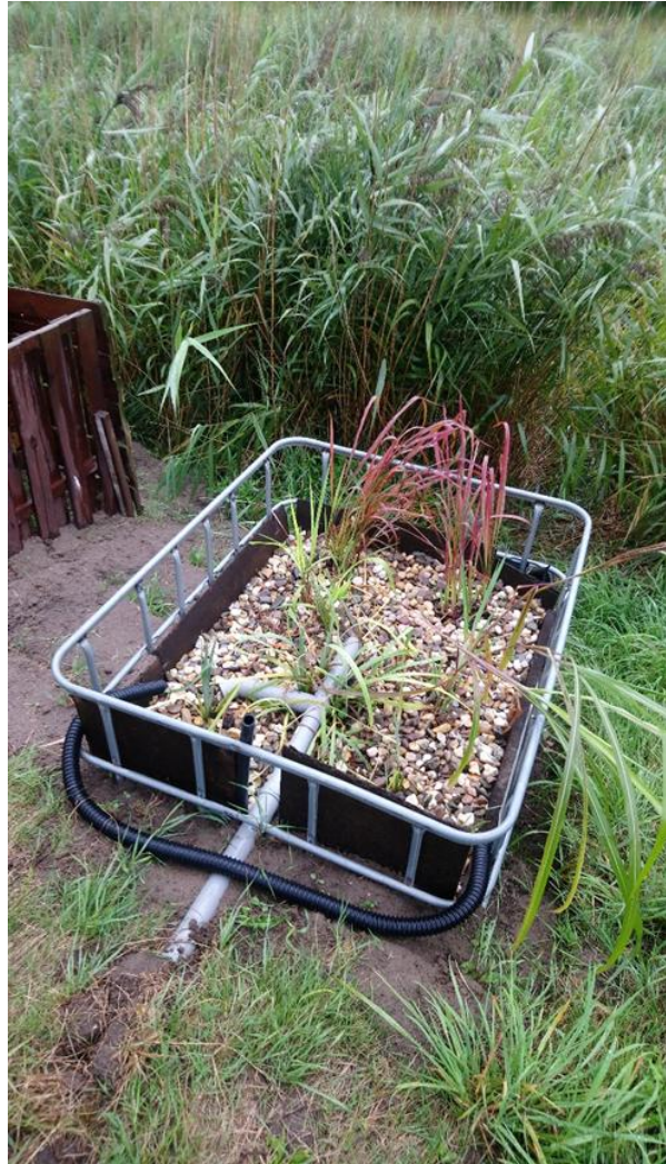
Afbeelding 5.3 Moerasfilter of helofytenfilter bij het off-grid tiny house om huishoudelijk afvalwater met behulp van moerasplanten, zand en stenen te filteren.