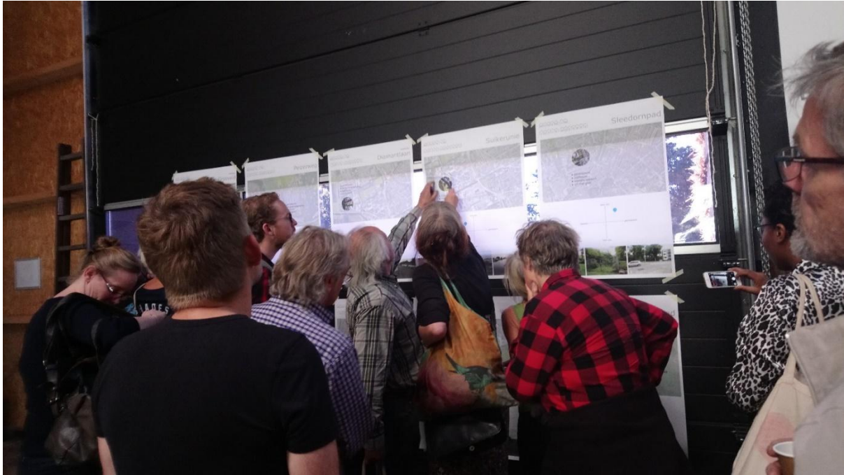
Afbeelding 2.4 Deelnemers aan het 'Lutje Hoeskes event' op 23 september 2017 in Groningen. Tijdens dit evenement gaven verschillende architectenbureaus en particulieren lezingen over tiny housing. Daarnaast konden bezoekers met hen en beleidsmedewerkers in dialoog gaan over tiny housing en het aanwijzen van mogelijke locaties voor het plaatsen van tiny houses in en rond de stad Groningen.

In Hoofdstuk 2 kwamen de (verschillende) definities van een 'tiny house' volgens een aantal respondenten binnen het onderzoek aan bod. Daarnaast is ook specifiek ingegaan op de Nederlandse context waar binnen de tiny houses binnen het onderzoek gevestigd zijn. Hierop aansluitend volgt in Hoofdstuk 3 'Theoretisch kader' een beschrijving van de centrale literatuur ten aanzien van fysieke en symbolische place-making onder tiny house bewoners, binnen het bredere kader van intentional woonvormen.