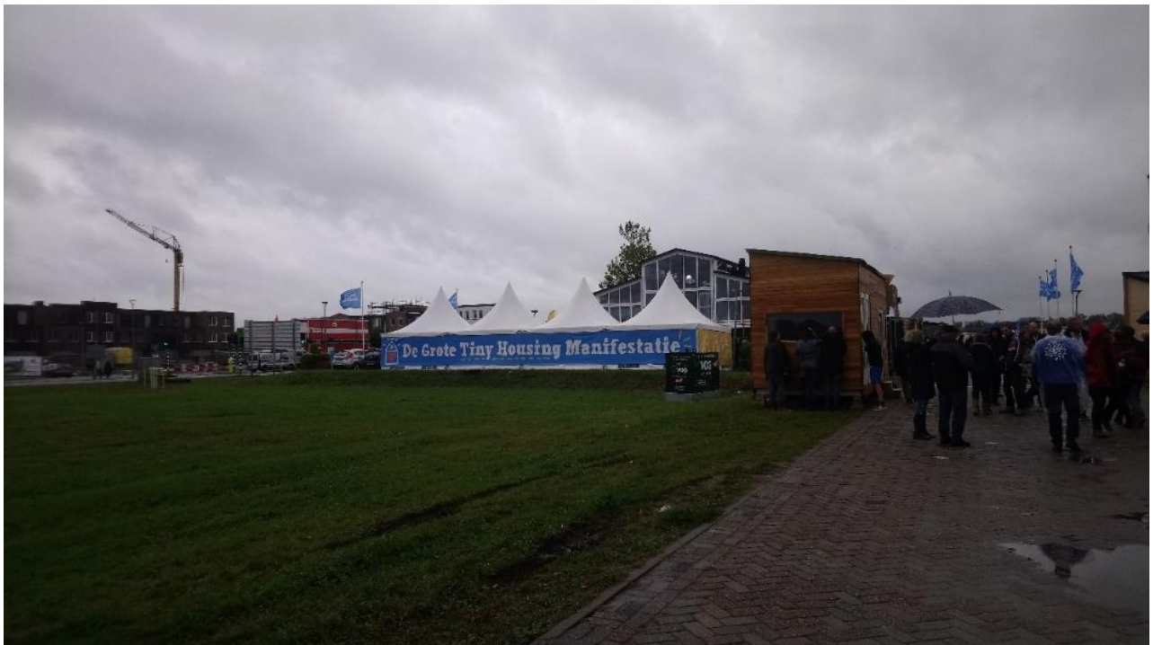
Afbeelding 5.17 De jaarlijkse Tiny House Jamboree in Almere, op 7 oktober 2017, waaraan sommige respondenten deelnamen.