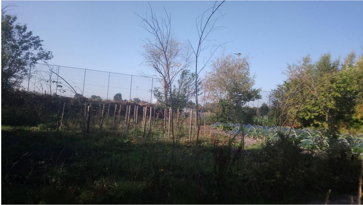
Afbeelding 5.11 Gezamenlijke moestuin, volgens de permacultuur ideologie, in wording op het woonterrein van een tiny house woongemeenschap.