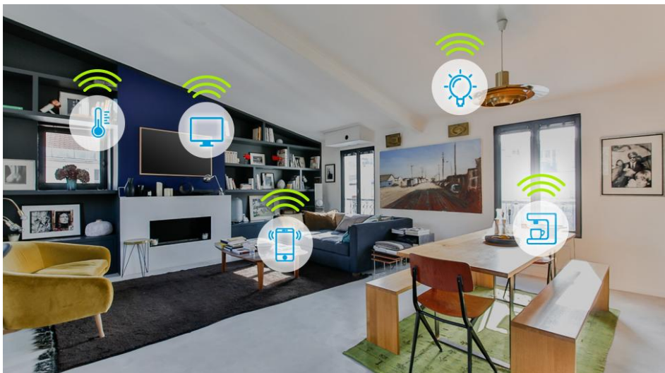
Afbeelding 3.4 Voorbeeld van een smart woning.