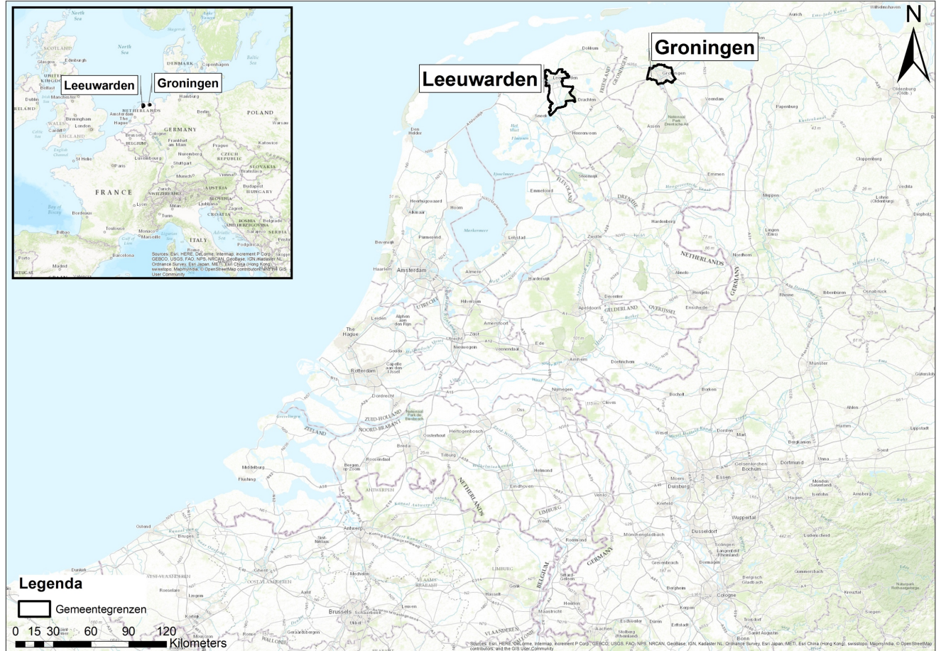
(Figuur 3. Locaties Gemeenten)