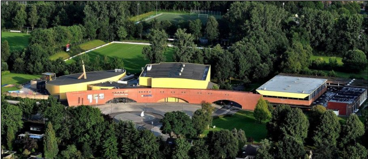
Figuur 2. Sportcentrum de Kalkwijck in Hoogezand-Sappemeer

De Kalkwijck als geheel is in de plaats gekomen voor het voormalige zwembad in Hoogezand, het Bob Bruinsbad. Dit zwembad werd rond de eeuwwisseling gesloten en de Kalkwijck werd opgeleverd als nieuw sportcomplex inclusief zwembad. De healthclub die een aantal jaren geleden in het gebouw is gekomen werkt samen met een in het gebouw aanwezige fysiotherapeut (Healthclub, 2013).