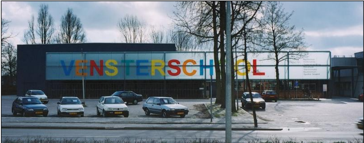
Figuur 1. Vooraanzicht van de Vensterschool Selwerd in Groningen (Bron: Atelier Pro, 2013)

Vensterplein; een hal waarin zich onder andere een café en de buurtkiosk bevinden (NOVO, 2013 en Tuinwijk, 2013).