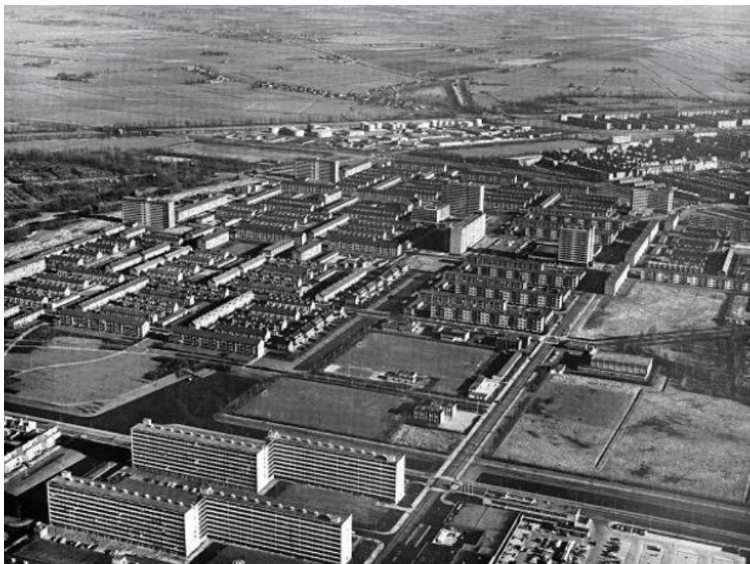
Figuur 5: Luchtfoto van Selwerd, gezien vanuit het westen (Paddepoel), circa 1971.