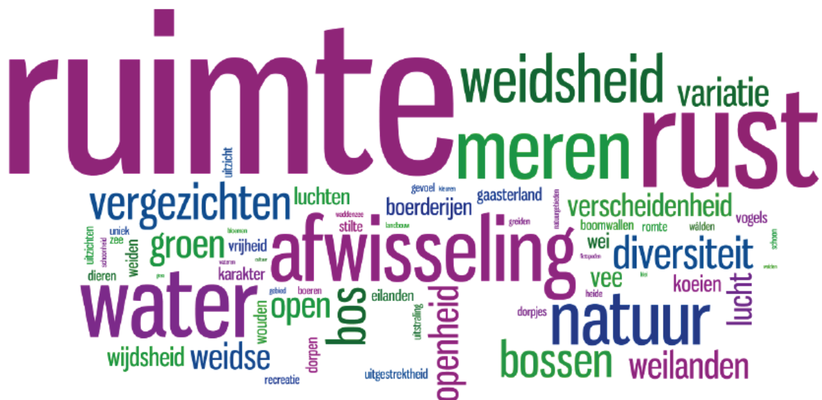
Figuur 2 Kracht van het Friese landschap (Partoer 2014).

In overeenstemming met het laatst genoemde citaat geeft ook Jensma (2010, pp.218-219) aan dat ‘het Friese landschap’ niet bestaat. “Er bestaat alleen maar veranderend landschap in Friesland en in dat landschap zijn verschillende tegenstrijdige belangen werkzaam.” Ook wordt in zijn artikel weer duidelijk dat het (Friese) landschap gemaakt wordt, zowel letterlijk en als beeld in ons hoofd. Hier zal het echter niet gaan over de discussie of het Friese landschap wel of niet bestaat, maar over het landschap in Friesland en de elementen daarin die het aantrekkelijk maken om het te schilderen. De relatie mens-landschap in het citaat van Hendrik sluit aan bij Taylor (2008) die stelt dat het karakter van het landschap de waarden reflecteert van de mensen die het gevormd hebben en erin wonen. De cultuur is daarin belangrijk. “ Landscape is a cultural expression that does not happen by chance but is created by design which relates directly to our ideologies ” (Taylor, 2008, p.7). Partoer (2014) geeft in een onderzoek naar de visie op het Friese landschap ook aan dat het ‘Friese landschap’ een lastige term is, omdat het bestaat uit vele verschillende typen landschap. Onderstaande figuur, uit het onderzoeksrapport, geeft de meest genoemde antwoorden weer op de vraag wat de kracht van het Friese landschap is. Veel van deze termen worden ook genoemd door de respondenten van dit onderzoek, zoals in bovengenoemde citaten; ruimte, weidsheid, diversiteit en water.