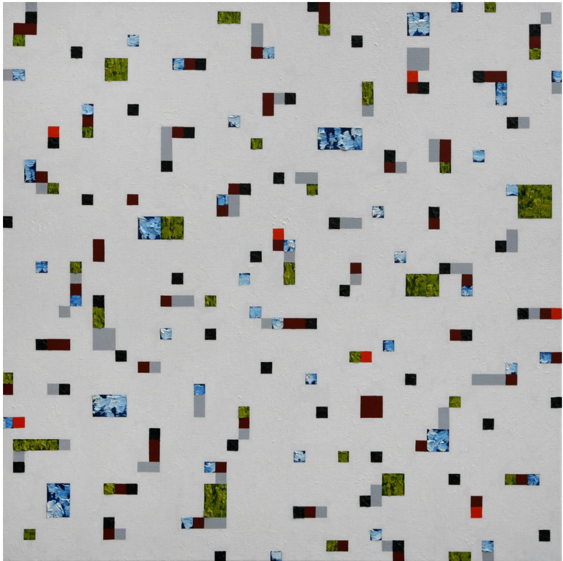
Figur 10 Milly Betten