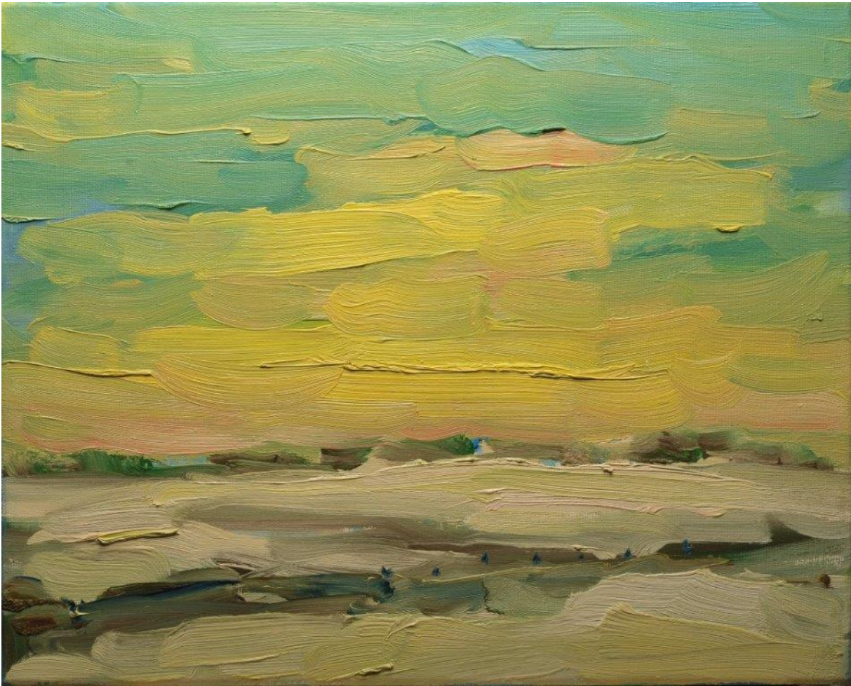
Figuur 11 Wim van der Veer