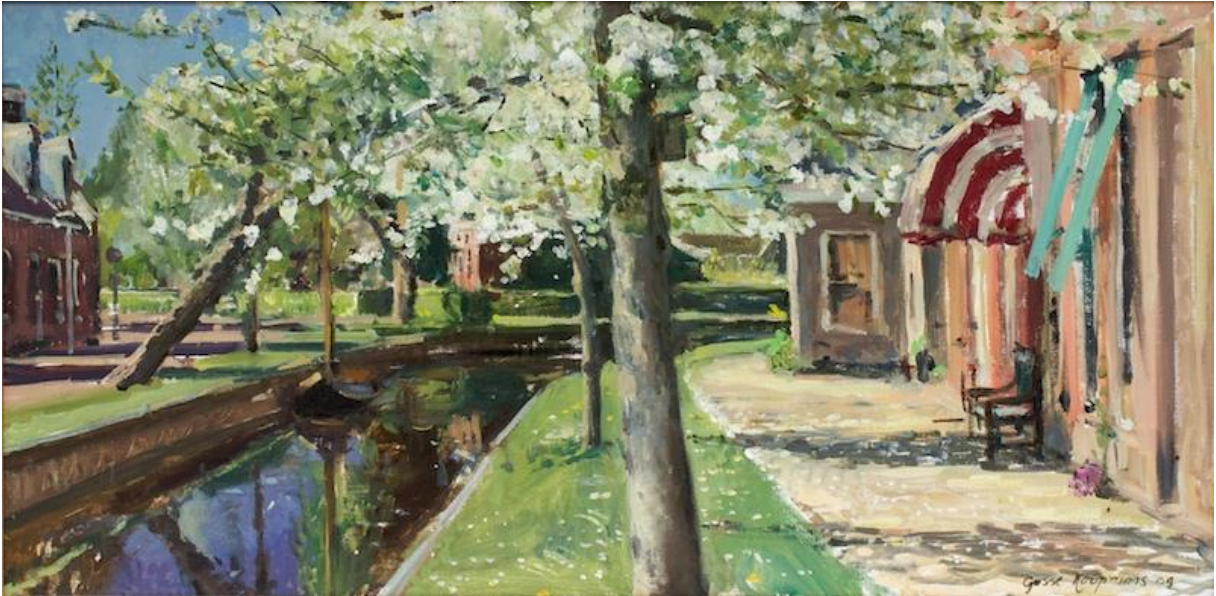
Figuur 8 Gosse Koopmans