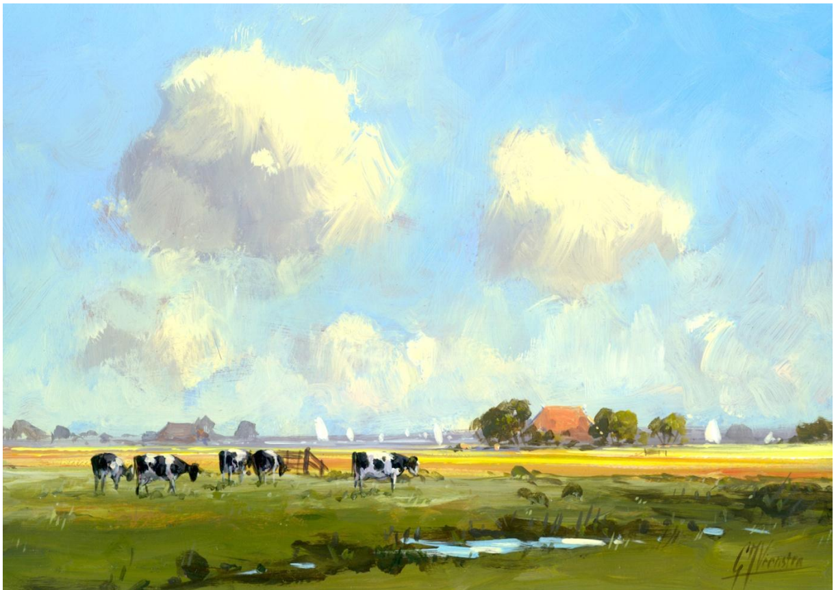
Figuur 7 Gert-Jan Veenstra