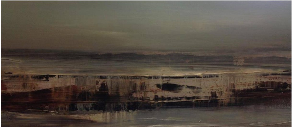
Figuur 5 Gea Koevoets