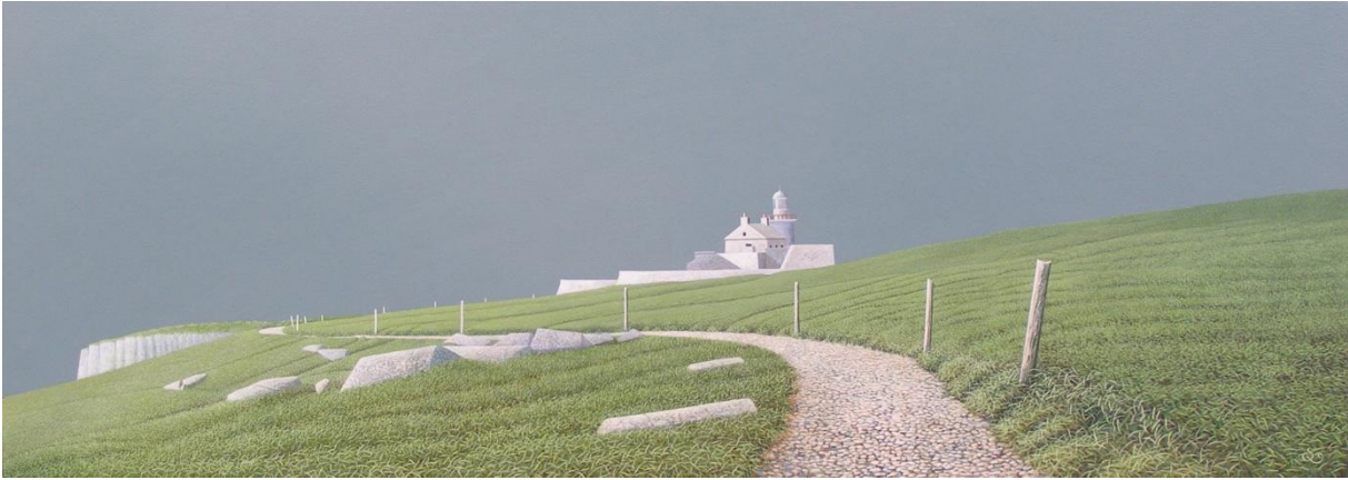
Figuur 12 Reinder Ourensma