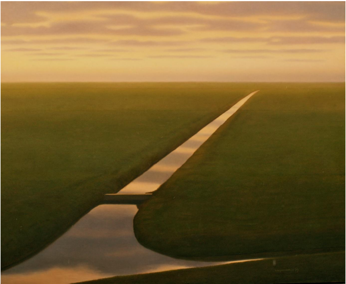
Figuur 6 Gerrit Wijngaarden