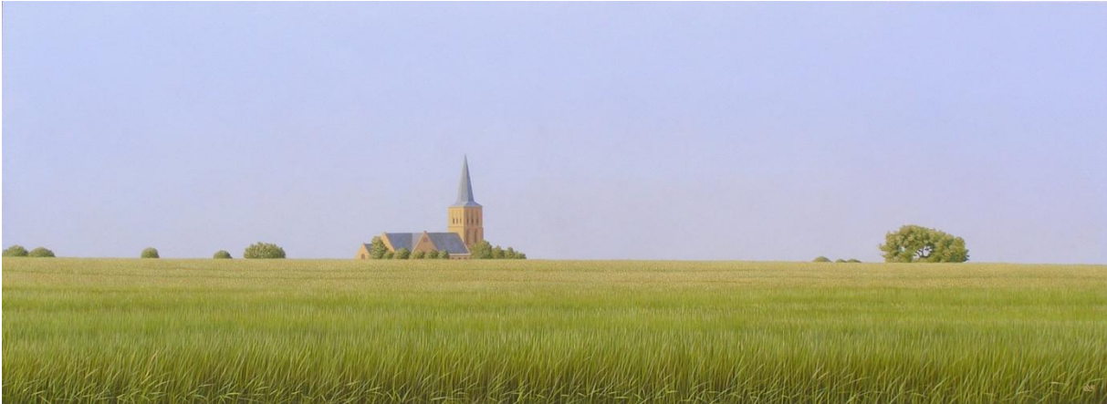
Figuur 13 Reinder Ourensma