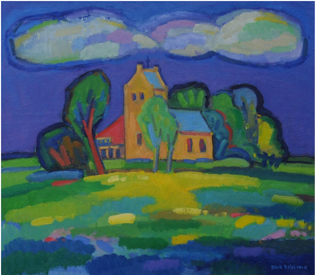
Figuur 3 Dirk Beintema – Westhem