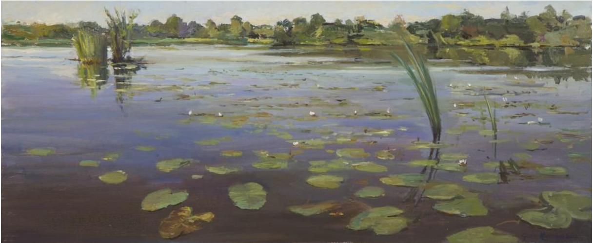
Figuur 9 Gosse Koopmans