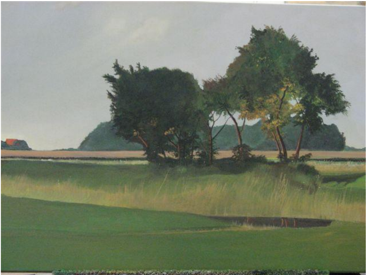
Figuur 14 Janneke Hengst