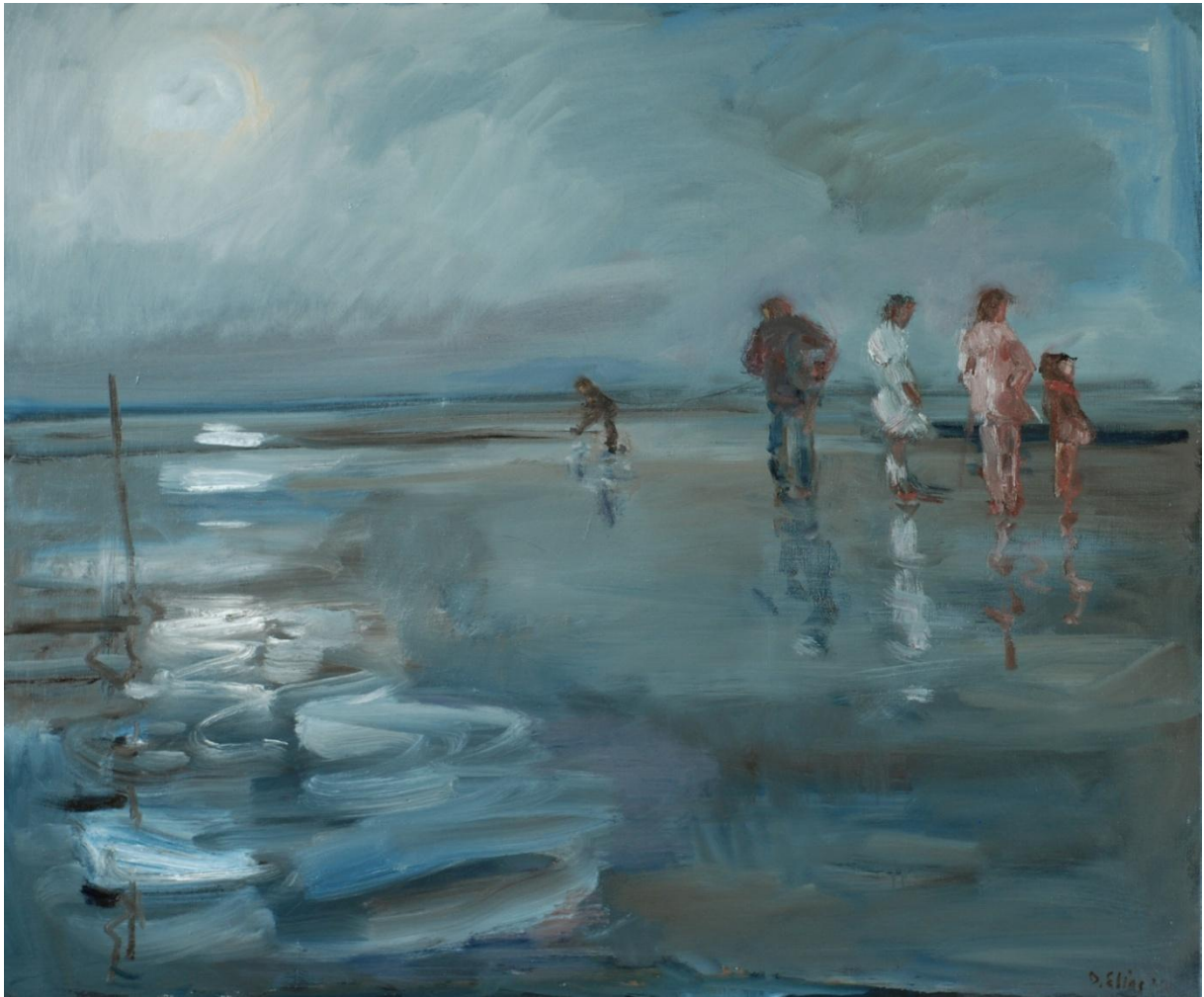
Figuur 4 Douwe Elias – “Jan aan touw”