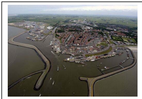
Afbeelding 5.3: Luchtfoto van Harlingen met op de voorgrond de haven.