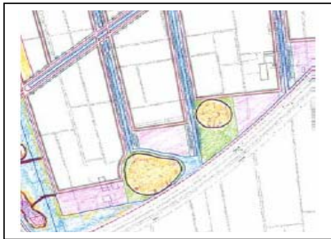
Afbeelding 5.7: Een deel van het plangebied van industrieterrein A7-Noord, de pingo's zijn geel gekleurd.

slechte kwaliteit dat men besloten heeft deze niet te handhaven. De andere drie pingo's zullen in het plan terugkomen. In eerste instantie zullen de pingo's groene plekken in het plan worden, in een later stadium zal er wellicht iets bijzonders mee worden gedaan. Hierover bestaat nog geen duidelijkheid.