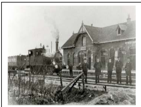
Afbeelding 5.2: Het oude station in Tzummarum.

De geïnterviewden kennen de Nota Belvédère. Deze nota is in Franekeradiel beter bekend dan bij de andere twee gemeenten die in het bundelingsgebied Harlingen/Franeker liggen. De medewerkers weten dat in de Nota Belvédère Franekeradiel als bijzonder terpenlandschap is aangewezen. De geïnterviewden zijn tevens op de hoogte van de subsidies die in het kader van Belvédère te verkrijgen zijn. Op de vraag of het feit dat Franekeradiel in de Nota Belvédère als bijzonder terpenlandschap is aangewezen invloed heeft op het beleid van de gemeente, antwoordt een van de medewerkers het volgende: “Het geeft ondersteuning aan het feit dat hier een belangrijk gebied ligt, en we daar rekening mee moeten houden” . Echt sprake van invloed is er niet. ‘Behoud door ontwikkeling’ wordt met name toegepast op de bebouwde omgeving. Het gaat dan vooral om het creëren van nieuwe functies in oude gebouwen. Een goed voorbeeld hiervan is het oude station in Tzummarum. Hier is cultuurhistorie het ‘leitmotiv’ geweest. Het station is een monument geworden en op de plaats waar vroeger de rails liepen is een fietspad aangelegd, de oude rails zijn ernaast gelegd.