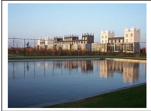
Afbeelding 5.9: "Wonen op een landgoed" in het nieuwe plan Skoatterwâld

gediend. Dit idee kwam overigens niet van de gemeente, maar van het bureau dat bij de plannen was betrokken. Het was dus geen bewuste keuze van de gemeente. De gemeente heeft echter wel bewust gekozen voor het aanhouden van het noord-zuid verkavelingspatroon. Dat patroon past goed bij de langwerpige noord-zuid structuur van Heerenveen.