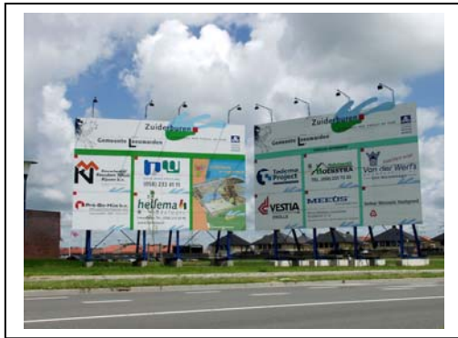
Afbeelding 3.4: Het uitbreidingsplan Zuidlanden in Leeuwarden.

kwelderwallen/terpenlandschap en een veenlandschap. In het nieuwe plan is nadrukkelijk rekening gehouden met de landschapstypen. Zij dienen als basis voor het stedenbouwkundige plan.