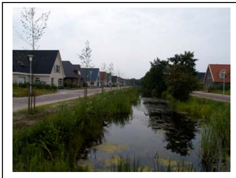
Afbeelding 5.8: Een elzensingel en een oude waterloop die ingepast zijn in het uitbreidingsplan Himsterhout.

Volgens de geïnterviewden “is het strikt beleid om waar mogelijk cultuurhistorische waarden mee te nemen in de plannen en te handhaven” . “Dit is geen toeval, er wordt de laatste drie jaar heel bewust naar gekeken” . De gemeente beschikt over eigen stedenbouwkundigen, de opstelling van plannen wordt niet vaak aan bureau's uitbesteed. De geïnterviewden melden dat “bij nieuwe bestemmingsplannen het landschap eigenlijk altijd de drager is van de indeling van het gebied” . Ten zuiden van de wijk De Trisken wordt de wijk Himsterhout gerealiseerd. Het gebied is zo'n zeventig hectare groot en biedt plaats aan plus minus 600 woningen. Het riviertje de Drait en de rijksweg A7 vormen de grenzen van de wijk. Deze oude waterloop is in het plan ingepast. De oevers van de Drait zijn in hun oude staat hersteld. Ook zijn hier oude elzensingels en sloten in het plan geïntegreerd. In het plan Burmaniapark is ruimte voor zo'n 250 woningen. In dit plan worden rekening gehouden met de verkavelingsrichting en bestaande boomwallen worden in het plan ingepast.