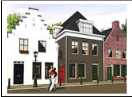
Afbeelding 5.6: 'Oude' gevels in het toekomstige recreatiedorp Esonstad

landschapsonwikkelingsplan. Het belang van een vroege inventarisatie van cultuurhistorische waarden wordt onderschreven. Dit is onontbeerlijk voor meer aandacht voor cultuurhistorie in ruimtelijke plannen. De gemeente kan door een vroege signalering van cultuurhistorische waarden veel voordeel behalen bij het opstellen van toekomstige plannen. Ook wordt benadrukt dat het streekplan een rol kan spelen bij het eerder opnemen van cultuurhistorische waarden in de planvorming. In het streekplan kunnen suggesties gedaan worden over welke waarden beschermd moeten worden en de gradaties van de bescherming.