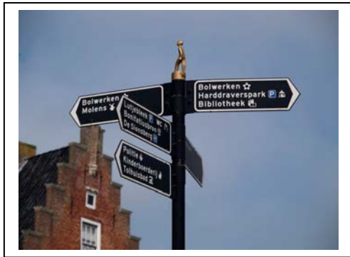
Afbeelding 5.5: Cultuurhistorie in de stad Dokkum.

Cultuurhistorie heeft volgens een van de medewerkers betrekking op “monumenten, archeologie en beeldbepalende structuren” . Monumentezorg “is wat verspreid door de organisatie heen” . De afdelingen bouwzaken en bouwkunde houden zich er beide mee bezig. Archeologie is bij ruimtelijke ordening ondergebracht. Op cultuurhistorisch vlak “speelt er nogal wat in de gemeente, met name in het centrum” . Dit heeft te maken met het feit dat in 2004 de moord op Bonifatius werd herdacht. In dat jaar was het 1250 jaar geleden dat Bonifatius in Dokkum werd vermoord. In dit kader is er een Bonifatiusroute uitgestippeld in het centrum van de stad.