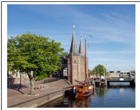
Afbeelding 5.10: De waterpoort van Sneek.

De cultuurhistorische kaart en de FAMKE zijn bekend bij de medewerkers. Bij het opstellen van plannen wordt de kaart altijd geraadpleegd. Met betrekking tot de FAMKE wordt opgemerkt dat “het heel aardig is dat je snel kan zien wat er aanwezig is en of je daar als gemeente rekening mee moet houden of juist meer onderzoek moet doen” . Een zwak punt van de FAMKE is dat er nogal wat blinde vlekken op staan. “Er is gewoon weinig bekend, als wij ergens gaan prikken vinden we eigenlijk altijd wel wat, ook al staat er op de kaart dat daar weinig kans op is” . De informatie over de historisch geografische en bouwkundige waarden is “een beetje karig” . Daar zou wel meer op mogen komen te staan. Sneek is op de hoogte van de verdiepingsslag voor de FAMKE en wil “zo snel mogelijk de gebieden waar nog blinde vlekken zijn in kaart brengen” . Wat betreft de cultuurhistorische waardenkaart zijn er geen plannen tot inventarisaties. De meeste waarden zijn al bekend, Sneek heeft ook maar een zeer klein buitengebied, vergeleken met andere gemeenten in Friesland.