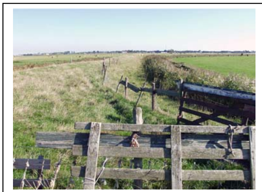
Afbeelding 5.1: Een bewaard gebleven stuk dijk dat deel uitmaakte van de Gouden Halsband.

De gemeente Wûnseradiel is met 11.957 inwoners een relatief kleine gemeente in de provincie Friesland. Wûnseradiel is een waterrijke gemeente die grofweg tussen de plaatsen Workum, Harlingen en Bolsward ligt. Wûnseradiel grenst aan de gemeenten Harlingen, Franekeradiel, Littenseradiel, Bolsward, Wunseradiel en Nijefurd. In het noordwesten ligt de Waddenzee; aan de westkant het IJsselmeer. Wûnseradiel is een echte plattelandsgemeente. De meeste inwoners zijn te vinden in de plaatsen Witmarsum, Makkum en Arum. Makkum is een zeer bekende watersportplaats en is in de zomer geliefd bij toeristen. Deze gemeente is in het kader van dit onderzoek interessant omdat zij deel uitmaakt van het Belvédèregebied 'Friese Terpen'. Dit gebied strekt zich uit van het westen tot het noordoosten van de provincie Friesland. Het terpengebied is een oud zeekeilandschap dat vanaf de tiende eeuw werd bedijkt. Het landschap bestaat uit een onregelmatige blokverkaveling, bebouwing op terpen en veelal grillige wegen en waterlopen (Nota Belvédère, 1999).