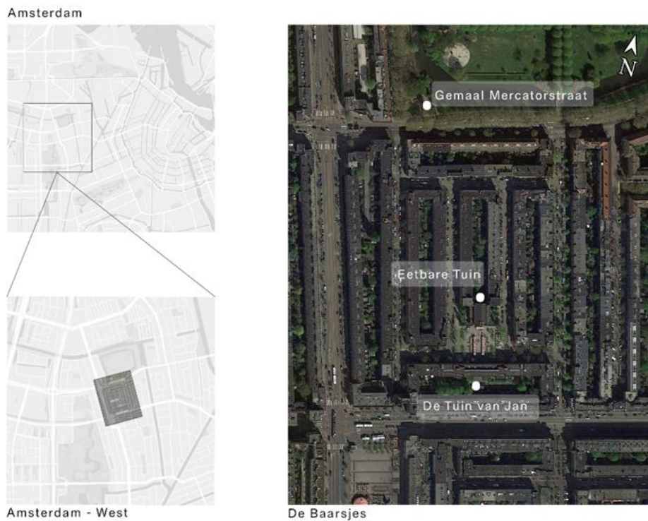
Figure 2: Map of case studies.