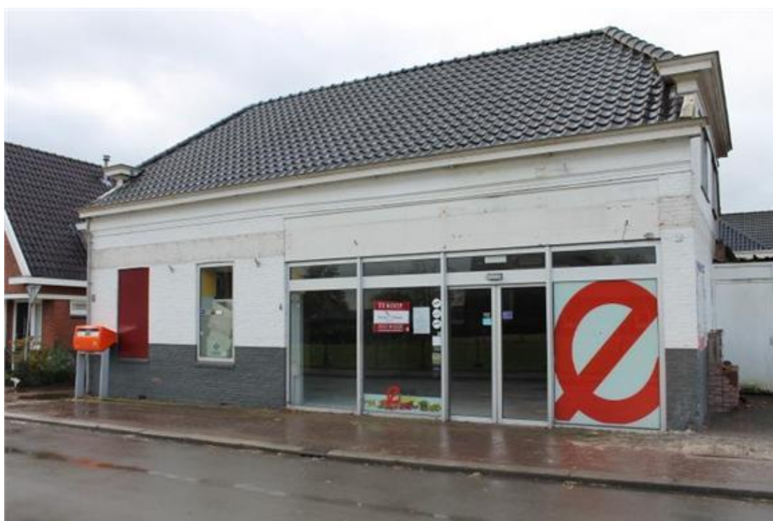
Figuur 1: deBM.nl. (2013) Koop winkelpand op Hoofdstraat 10.