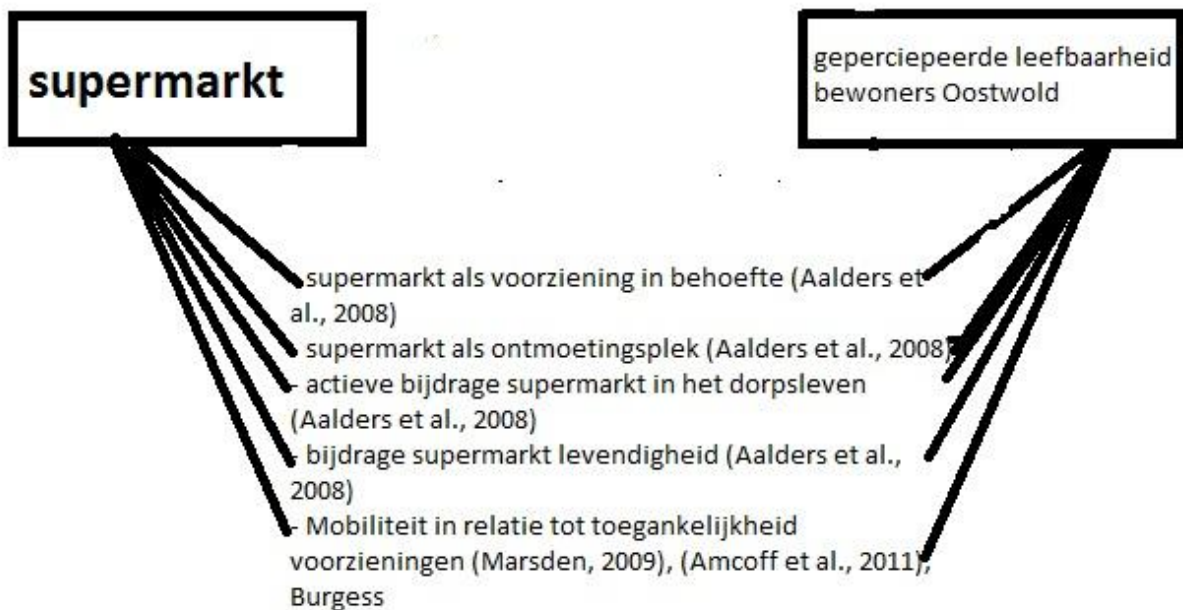
Figuur 3: Conceptueel model

Bovenstaand conceptueel model geeft de relatie tussen de supermarkt en de gepercipieerde leefbaarheid weer. Aan de hand van voorgaande theorieën over deze relatie is de wederzijdse relatie tussen deze theorieën en de 'supermarkt' en 'gepercipieerde leefbaarheid bewoners Oostwold' weergegeven.