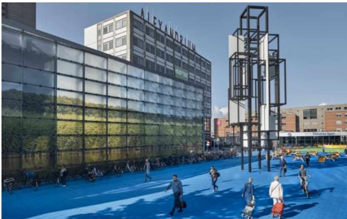
Figure 1.2 Prins Alexanderplein by Studio 75B. Source: Hans Wilschut

The square is painted blue, and in addition some parts are painted green, and on the façade a picture of the Dutch waters is printed, altogether representing the polder which the area is located in. The area once arose from the peat polder, and is located in the lowest point of the Netherlands. For the locals the blue and green markings also symbolize pride, they are proud of living in the polder which is created by human force (BKOR, 2021). The artwork creates awareness among inhabitants, they become aware of the environment they are living in and in addition of the renewal of the square that is taking place. The artwork also attracts entrepreneurs to locate in the area and to be part of the developments that are going on in this area. In brief, the artwork can be viewed as a spatial temporary tool to create history awareness and development awareness at the square.