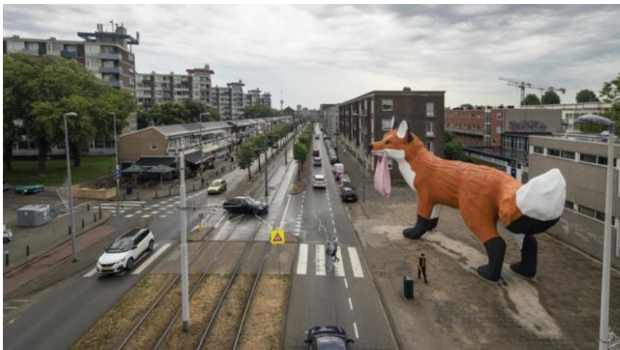
Figure 1.1 Bospoldervos, by Florentijn Hofman.

The main reason for building the artwork was the revitalization of the Schiedamseweg. The Schiedamseweg is often referred to as a concrete jungle, it's located at the edge of the city, there are no green spaces, just concrete and aesthetically not attractive (Projectleader BKOR, 2021) (Hofman, 2021). More than two hundred local residents and local entrepreneurs were involved and pondered the question of what kind of artwork would fit best in this long, busy street (BOTU, 2020). The neighborhood agreed, it had to be the fox of Florentijn Hofman (BOTU, 2020). It's a child friendly statue located in front of a school and the statue represents a new entrance to the revitalizing Bospolder-tussendijken.