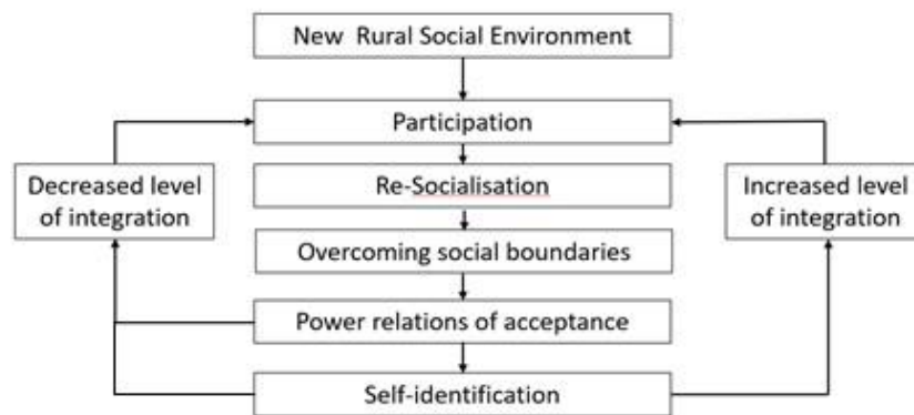
Figure 2: Process of social integration of urban migrants into a rural community.

Then after some time it will be decided if the in-migrant has conducted themselves well enough to be accepted by the locals. The locals in this self-built social institution have the power to decide whether the in-migrant is accepted or rejected more within their community. If they are not accepted they can start over at the participation step in order to learn more. If they are accepted they can start to feel more like part of the locality and have higher self-reported levels of social integration, while their input for future plans for the village might also be taken into consideration from this point on.