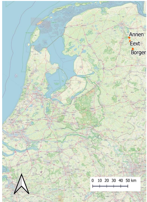
Figure 3: Location of villages in the rest of the Netherlands. Basemap: OSM. Adapted by author (2021)

The interviews were transcribed and coded using the Atlas.ti analysis software for ease of access to quotes relating to different factors in social integration. Instead of determining beforehand, the codes were assigned based on which topics were commonly named by participants after multiple readings of the material. The code list with names, groups and frequencies is included in appendix 3.