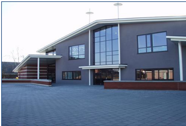
Afbeelding 1: MFA 't Aambeeld in Vlagtwedde (Geveke, 2012).

Onderstaand zijn de verschillende brede scholen afgebeeld die hebben gediend als case voor dit onderzoek.