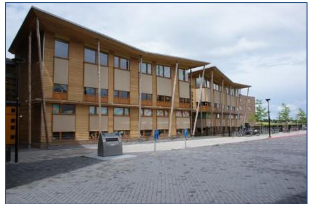
Afbeelding 2: MFA De Spil in Heerenveen (Kinderwoud, 2012)