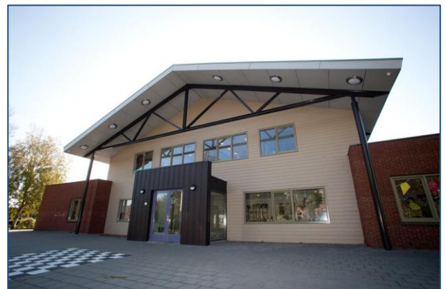
Afbeelding 4: MFA De Treffte (Bekkema Bruinsma, 2012).