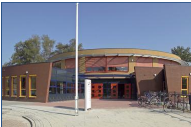
Afbeelding 3: Brede school De Samensprong in Haulerwijk (Bureau Bos, 2012).