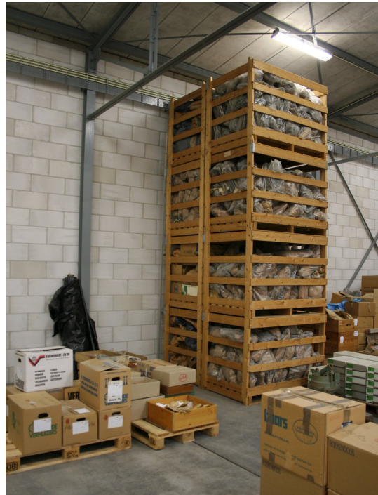
Figuur 1.1: Menselijke resten uit Aduard in het Noordelijk Archeologisch Depot.

Niet veel later sprak Betten met mijn begeleider Peter Groote over de cultureel geografische potentie van dit onderwerp. Aangetrokken door de kwestie besloot Groote het op de keuzelijst te zetten als scriptieonderwerp. Ik heb deze situatie aangegrepen om me te verdiepen in de juiste plaats voor deze menselijke resten. In dit onderzoek is de discussie in kaart gebracht en zijn de ethische kanten van het kwestie belicht.