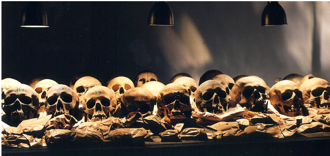
Figuur 1.2: Deel van de tentoonstelling 'tussen Hel en Hemel' in het Groninger Museum van 2001.

Deze verschillende voorbeelden roepen vragen op omtrent de menselijke resten uit Aduard. De resten liggen nog in het Noordelijk Archeologisch Depot te Nuis, maar horen ze daar wel thuis? Dit onderzoek gaat specifiek in op de plaats van de menselijke resten uit Aduard. Begraven in Aduard, opgegraven in 1940, opgeslagen op verschillende locaties in de provincie en in 2001 tentoongesteld in het Groninger museum. Waar horen ze?