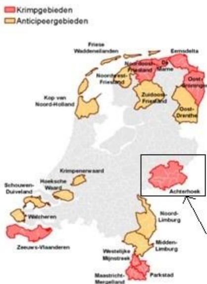
(Figuur 1: Krimpgebieden en anticipatiegebieden Nederland, Rijksoverheid 2015)

Er zijn verschillende definities van een streek te vinden in de huidige literatuur. Zo zegt Brouwer (1999, p.18) dat “de begrenzingen van een regio willekeurig zijn en afhankelijk van het perspectief van waaruit een gebied betekenis krijgt.” Simon (2005, p.14) stelt dat: “ (...) streken een sociale constructie zijn en (...) gezien kunnen worden als de producten van specifieke relaties en uitingen van sociale verhoudingen.” Hiermee wordt bedoeld dat de creatie van een streek een sociale handeling is en dat streken verschillen omdat mensen die zo gemaakt hebben (Johnston, 1990 in Simon, 2005). Bovendien stelt Simon (2005) dat het belangrijk is om naast het element ‘betekenis’ ook het schaalniveau bij conceptualisering van streken in acht te nemen.