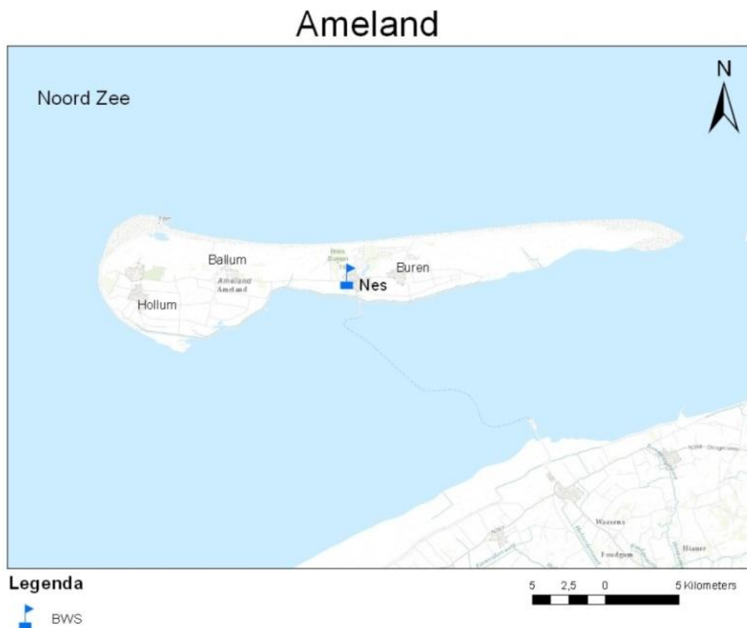
Figuur 1. Ameland met locatie BWS.

De gegevens van de enquêtes zijn in SPSS gecodeerd. Hierdoor is het makkelijk om de gegevens te verwerken en er tabellen mee te maken. De tabellen moeten er voor zorgen dat het presenteren en vinden van gegevens en uitkomsten overzichtelijker wordt. Alle gegeven percentages in de tabellen zijn echter in de tekst tot het dichtstbijzijnde significante cijfer tot hele getallen afgerond, omdat het hier om aantallen personen gaat.