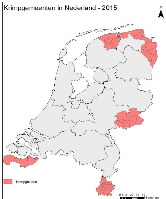
Figuur 1

Het huidige Nederlands ruimtelijk beleid is voornamelijk gericht op groeiende regio's (Delfmann, 2015; Delfmann et al., 2014). Ook ruimtelijk-economische theorieën zijn voornamelijk gericht op groeiende steden en regio's. Dit gebeurt terwijl demografische krimp vaak in verband wordt gebracht met een verminderde economische vitaliteit (Delfmann, 2015; Delfmann et al., 2014). Tegelijkertijd kan demografische krimp een negatieve invloed hebben op het aantal startende bedrijven (Delfmann et al., 2014). Een aantal bedrijfssectoren is oververtegenwoordigd op het platteland. Soms spelen fysieke aspecten, omgevingsaspecten en mogelijkheden voor recreatie en toerisme een rol. Ook betreft het bedrijfssectoren die relatief veel ruimte nodig hebben, lagere grondprijzen op het platteland staan hierbij centraal (Strijker & Markantoni, 2011).