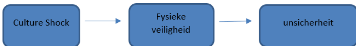
Figuur 2: Conceptueel Model

Er zijn contrasterende resultaten over de fysieke veiligheid die internationale studenten ervaren, hierdoor is het interessant om te kijken hoe het is gesteld met het gevoel van fysieke (on)veiligheid onder Indiase studenten in Groningen. Ook is er in de literatuur nooit specifiek gekeken naar de invloed van culture shock op het gevoel van Fysieke (on)veiligheid. Dit gat in de literatuur zal in dit onderzoek behandeld worden. Het verwachte verband wordt weergegeven in figuur 2. Hierin is weergegeven dat de verwachting is dat culture shock invloed zal hebben op de fysieke veiligheid en dit op zijn beurt weer leidt tot een breder gevoel van onzekerheid.