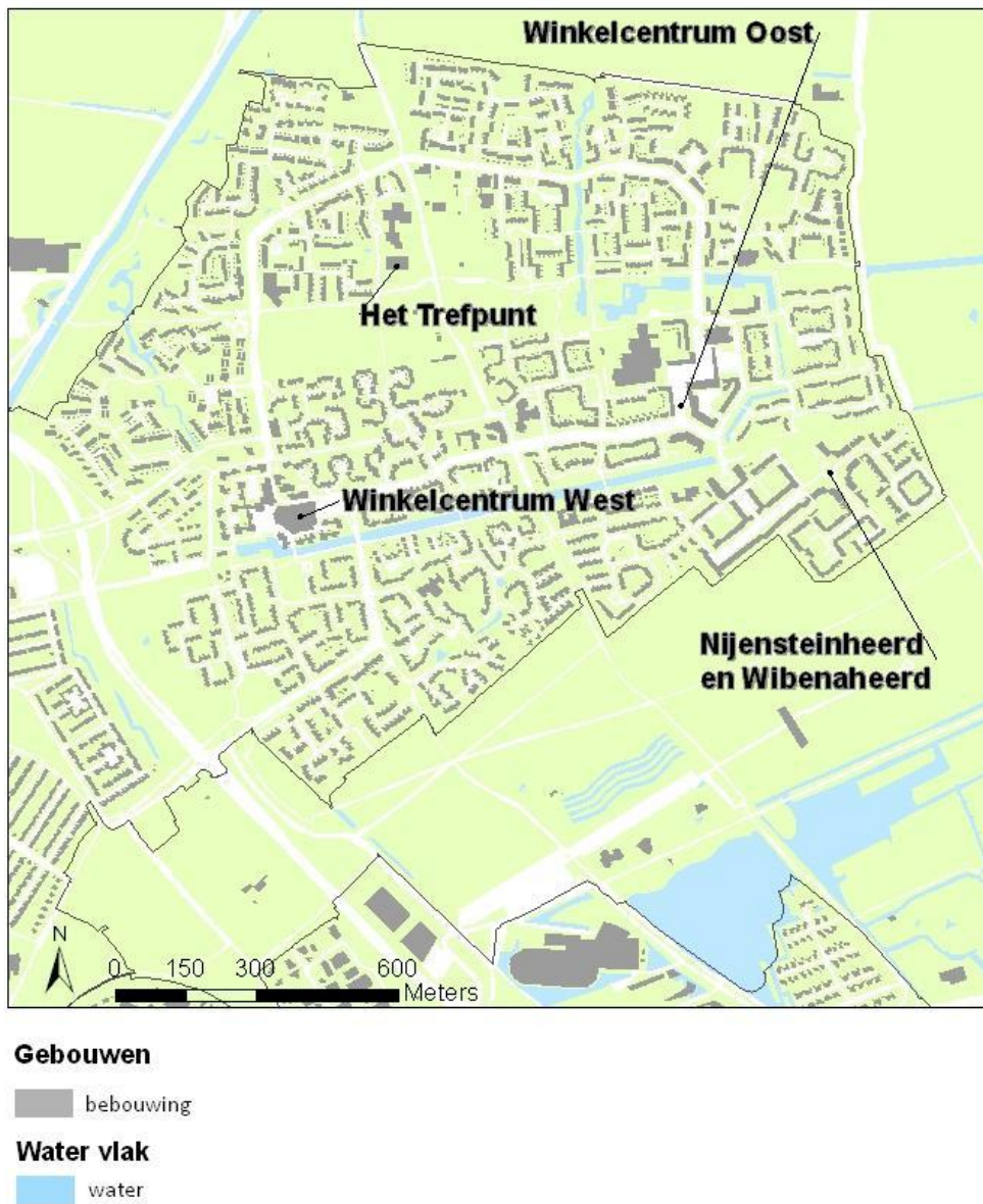
Kaart 2: Locatie van Trefpunt, de winkelcentra en de straten Wibenaheerd en Nijensteinheerd, (bron: Top 10NI, ArcGis, 2014 & CBS, 2014)