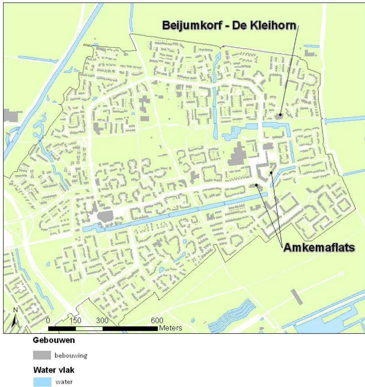
Kaart 3: locatie van De Kleihorn en de Amkemaflats