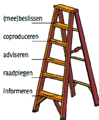
Figuur 1: Participatieladder (Edelenbos & Monnikhof 2001)

Naast de verschillende vormen van participatie zijn er ook verschillende maten van participatie te onderscheiden. Tussen interactief en niet-interactief beleid is een geleidelijke overgang te zien waarin beleidsarrangementen in meer of mindere mate als interactief kunnen worden aangeduid. Hierbij kan het initiatief van zowel overheden komen als van burgers of andere private actoren. Het initiatief bepaalt ook mede de mate van de interactiviteit. De mate van interactiviteit loopt van indirecte participatie tot reflexieve participatie. Deze mate wordt door onder andere Edelenbos uitgewerkt in de participatieladder (Figuur 1) bestaande uit vijf verschillende 'treden' van interactie: 1) informeren, 2) raadplegen, 3) adviseren, 4) coproduceren en 5) meebeslissen (Edelenbos et al 2006).