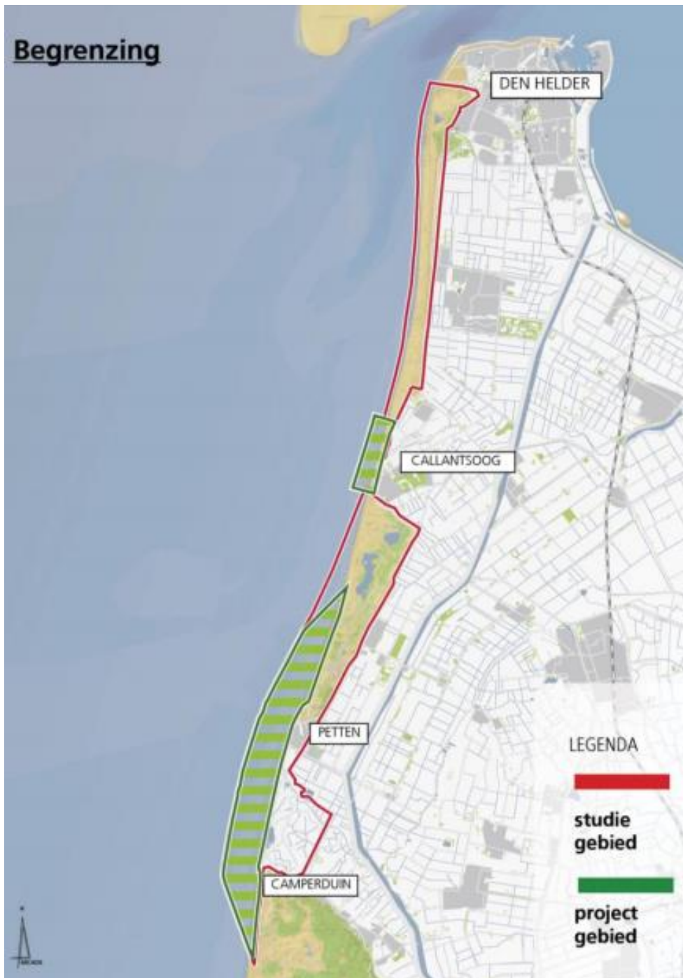
Figuur 4: Studiegebied en projectgebied Zwakke Schakels Noord-Holland (HHNK & Provincie Noord-Holland 2013d)

Wanneer in dit onderzoek gesproken wordt over 'Zwakke Schakels Noord-Holland' gaat het over de samenwerking tussen de twee Zwakke Schakels aan de Noord-Hollandse kust, namelijk de versterking van de Hondsbossche en Pettemer Zeewering inclusief de aansluiting en daarnaast de versterking van de Duinen Kop van Noord-Holland bij Callantsoog (zie figuur 4). Dit onderzoek is specifiek gericht op de versterking van de Hondsbossche en Pettemer Zeewering. Dit project wordt ook wel 'Kust op Kracht' genoemd, maar aangezien dit project sterk verbonden is met de versterking van de Duinen Kop van Noord-Holland zijn documenten vaak gericht op beide projecten. In dit onderzoek zal dit terug komen als 'Zwakke Schakels Noord-Holland'.