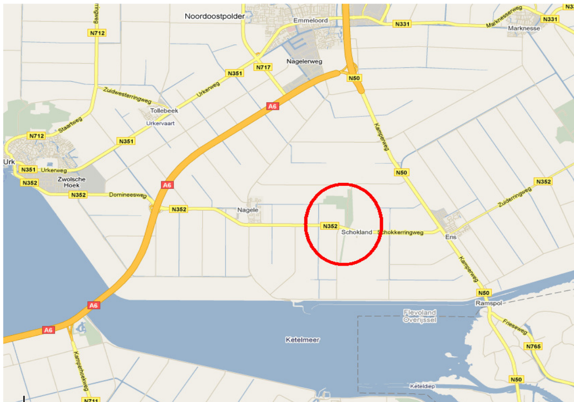
Figuur 1.1: Schokland in de Noordoostpolder