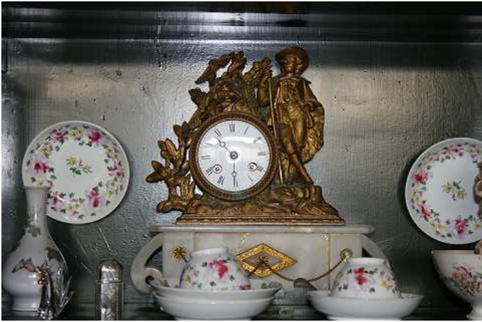
Afbeelding 5.1 Klokje geplaatst in zicht van de eigenaar (Tempel, vrouw, >85 jaar)

Tempel: "Nou, dat vond ik wel leuk, zo heb ik er gezicht op"