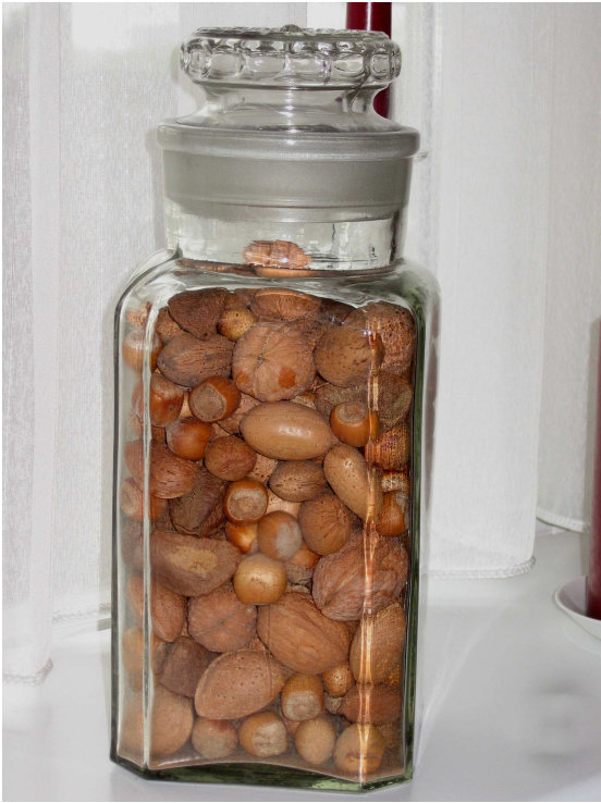
Afbeelding 4.4 Representatie van een geliefd persoon, stockfles (Koldam, vrouw, >75 jaar)

Het aanwezig laten zijn van het object geeft de verbondenheid met en de geliefdheid van de persoon weer. Het is een manier om de relatie met een geliefd persoon voort te zetten (Cooper Marcus 1992). Het vertelt ook waarmee de eigenaar wil worden geïdentificeerd.