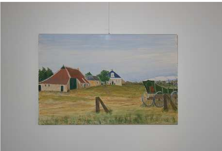
Afbeelding 4.1 Visuele representatie van een plek uit de kindertijd (Consten, vrouw, >75 jaar)

Objecten in de woning die enkel de plek representeren zijn alleen in de vorm van een foto of schilderij aanwezig. Het zijn afbeeldingen van het ouderlijk huis of van andere plekken, zoals een vakantiehuis of een natuurgebied, waar men tijd heeft doorgebracht of waar men graag komt. Deze afbeeldingen zijn vaak wat minder prominent aanwezig in de woning, ze hangen vooral in de slaapkamer. Afbeeldingen 4.1 en 4.2 zijn twee voorbeelden van visuele representaties van belangrijke plekken, er staan beschrijvingen bij van de respondenten.